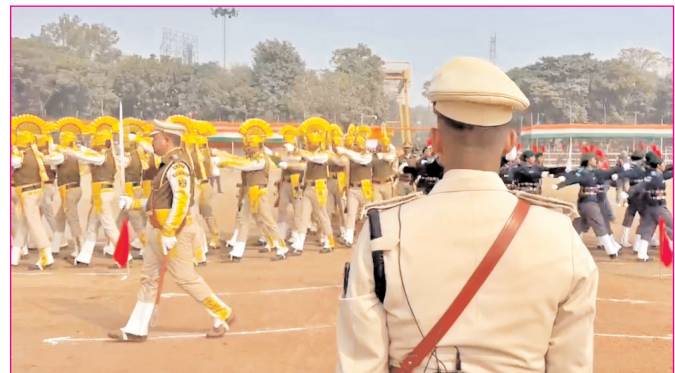
पटना के गांधी मैदान में गणतंत्र दिवस को लेकर रिहर्सल करते जवान