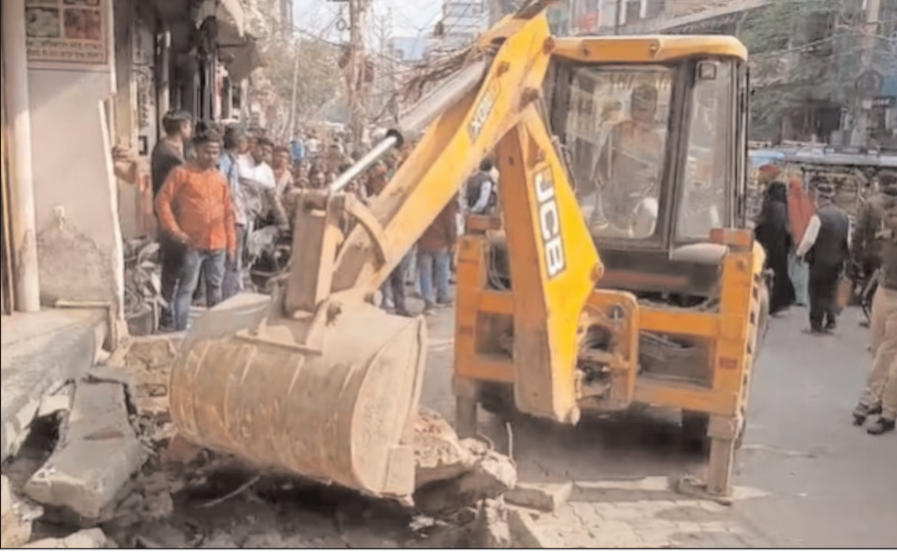
अतिक्रमण करने वालों को पहला नोटिस दिया गया है। नोटिस में तय