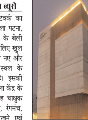
अर्थशिला पटना का उद्देश्य शहर को पुनः एक प्रमुख आधुनिक,

पटना। आर्थशिला नेटवर्क का नवीनतम केंद्र, आर्थशिला पटना, 27 जनवरी को पटना के बेली रोड पर आम जनता के लिए खुल रहा है जो शहर में एक नए और महत्वपूर्ण सांस्कृतिक स्थल के आगमन का संकेत है। इसकी परिकल्पना एक बहु-कला केंद्र के रूप में की गयी है। यह चाखूक कला, सिनेमा, साहित्य, संगीत, संगीत को देखने, परखने एवं समीक्षा करने के लिए सामुदायिक भागीदारी को आमंत्रित करता है।