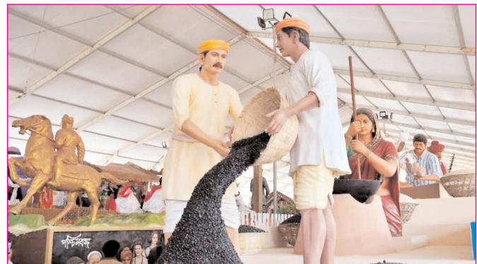
नयी दिल्ली में गणतंत्र दिवस की झांकी में दिखे बिहार का मखाना उत्पादन