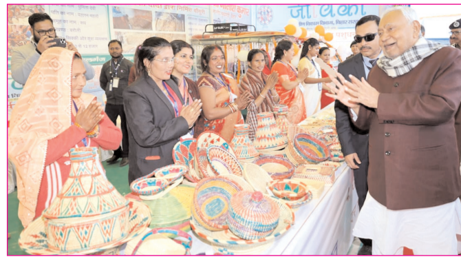
गोपालगंज में समृद्धि यात्रा के क्रम में विभागीय योजनाओं के स्टॉल का निरीक्षण करते सीएम नीतीश कुमार

* मूल्य : 3.00 रुपये * औरंगाबाद एवं बोकारो से प्रकाशित * www.navbihartime.com