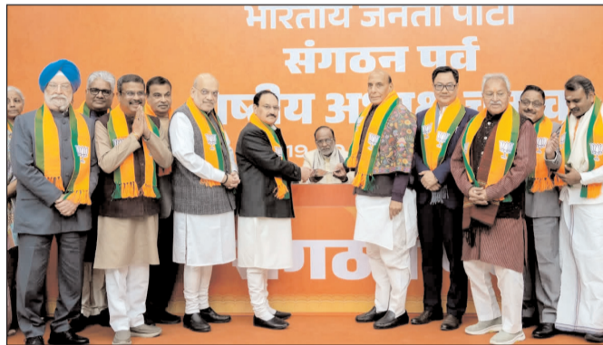
रहे। बिहार, आंध्र प्रदेश, महाराष्ट्र, असम, झारखंड और अन्य राज्यों के नेताओं ने भी नबीन के समर्थन में नामांकन पत्र जमा किए। पार्टी सूत्रों के अनुसार नबीन के पार्टी के 12वें राष्ट्रीय अध्यक्ष के रूप में निर्विरोध चुने जाने की

पार्टी के कई वरिष्ठ नेताओं ने किया है। भाजपा अध्यक्ष जेपी नड्डा, रक्षा मंत्री राजनाथ सिंह और गृह मंत्री अमित शाह के अलावा सड़क परिवहन और राजमार्ग मंत्री नितिन गडकरी के अलावा धर्मेश्वर प्रधान, भूपेंद्र यादव और किरेन रिजजू जैसे वरिष्ठ पार्टी नेता भी नबीन के नामांकन के समय मौजूद रहे। अरुणाचल प्रदेश के मुख्यमंत्री पेमा खांडू और अन्य राज्य नेताओं ने भी नबीन के समर्थन में नामांकन पत्रों का एक सेट जमा किया। नामांकन प्रक्रिया के दौरान उत्तर प्रदेश के मुख्यमंत्री योगी आदित्यनाथ, पुष्कर सिंह धामी, नाथ सिंह सैनी और प्रमोद सावंत भी उपस्थित