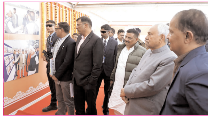
शिवहर में विभिन्न योजनाओं का जायजा लेते सीएम नीतीश कुमार

* मूल्य : 3.00 रुपये * औरंगाबाद एवं बोकारो से प्रकाशित * www.navbihartime.com