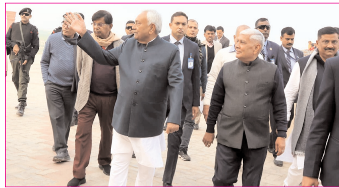
पटना के बख्तियारपुर में कराये गये विकास कार्यों का जायजा लेते मुख्यमंत्री नीतीश कुमार

* मूल्य : 3.00 रुपये * औरंगाबाद एवं बोकारो से प्रकाशित * www.navbihartime.com