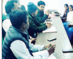
सामुदायिक सहभागिता पर दिया बल

ग्राम सभा में यह स्पष्ट किया गया कि जल जीवन मिशन की सफलता के लिए सामुदायिक सहभागिता अत्यंत आवश्यक है। ग्रामीणों से जल स्रोतों की सुरक्षा, पानी के सदुपयोग एवं योजना की निगरानी में सक्रिय भूमिका निभाने की अपील की गई। ग्राम सभा का आयोजन नावाडीह प्रखंड के बाराडीह, गोमिया प्रखंड के हजारी पंचायत, पेटेरवार प्रखंड के चापी पंचायत, चास प्रखंड के ऋतुडीह - हैसाबात - बांसगोरा में ग्राम सभा आयोजित किया गया। ग्राम सभा में पंचायत प्रतिनिधि, सहायक अभियंता, कनीय अभियंता, वास कोऑर्डिनेटर, यूनिसेफ सपोर्ट टीम, जल सहाया एवं बड़ी संख्या में ग्रामीण उपस्थित थे।