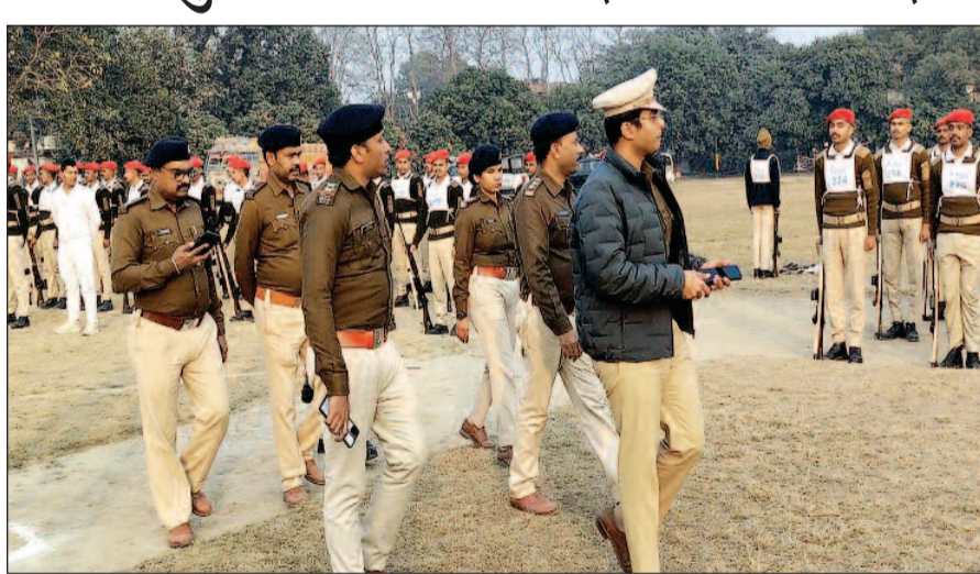
पुलिसिंग की चुनौतियों के अनुरूप तैयार करने का निर्देश दिया। जिसमें व्यवहारिक प्रशिक्षण, तकनीकी दक्षता तथा केस-आधारित अभ्यासों को विशेष प्राथमिकता दी जाए। इस क्रम में पुलिस अधीक्षक द्वारा जीविका दीदी

एसपी ने कहा उनके भीतर टीम वर्क, समय पालन तथा सेवा भावना जैसे मूलभूत गुणों का समुचित विकास सुनिश्चित कराया जाना है। उन्होंने प्रशिक्षण पाठ्यक्रम को आधुनिक