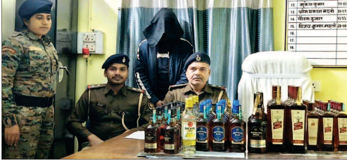
सीएनजी टैपो नं.- बीआर 11 पीसी 9947 उसके विरुद्ध कांड संख्या 04/26 दर्ज कर थानाध्यक्ष ने बताया कि एक मोबाइल भी को हिरासत में लेकर थाना ले आई। जहाँ न्यायिक हिरासत में भेज दिया गया है।