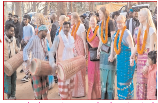
दुमका में सोहराय मिलन समारोह में आदिवासियों संग नृत्य करते विदेशी मेहमान