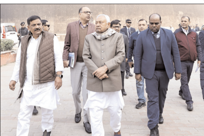
निर्देश दिया ताकि यह स्थल और अधिक आकर्षक व मनोरम दिखाई दे। मुख्यमंत्री ने कहा कि वर्ष 2013 में शुरू किए गए

नवबिहार टाइम्स ब्यूरो पटना। मुख्यमंत्री नीतीश कुमार ने रविवार को पटना स्थित ऐतिहासिक गोलघर परिसर का भ्रमण कर वहां की वर्तमान स्थिति का जायजा लिया। भ्रमण के दौरान मुख्यमंत्री ने गोलघर परिसर के पार्क, स्ट्रक्चर की स्थिति के साथ-साथ लाइट एंड साउंड शो तथा लेजर शो की व्यवस्थाओं का भी निरीक्षण किया। निरीक्षण के क्रम में मुख्यमंत्री ने संबंधित अधिकारियों को आवश्यक दिशा-निर्देश देते हुए कहा कि गोलघर एक महत्वपूर्ण ऐतिहासिक धरोहर है, जिसे देखने के लिए बड़ी संख्या में लोग आते हैं। उन्होंने अधिकारियों को गोलघर परिसर के सौंदर्यकरण और नियमित रखरखाव को बेहतर ढंग से सुनिश्चित करने का