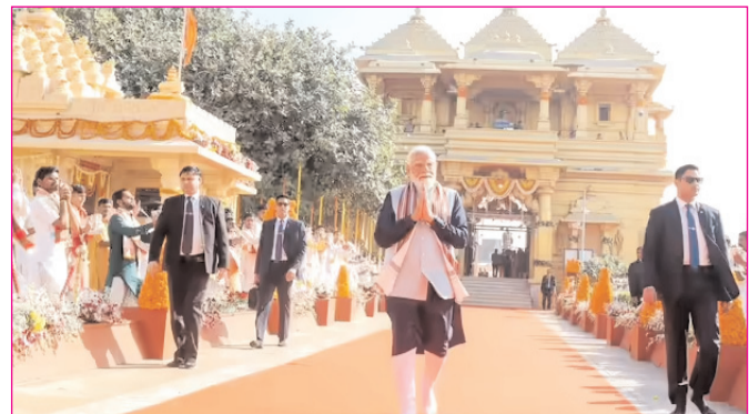
शौर्य यात्रा के बाद पीएम नरेन्द्र मोदी ने सोमनाथ मंदिर पहुंच कर आशीर्वाद लिया

* पटना संस्करण * रजि. नंबर : 52290/90 * वर्ष : 36 * अंक : 226 * पृष्ठ : 12 * औरंगाबाद, सोमवार, 12 जनवरी 2026 * मूल्य : 3.00 रुपये * औरंगाबाद एवं बोकारो से प्रकाशित * www.navbihartime.com