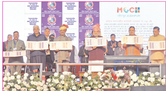
जोधपुर में माहेश्वरी गौरव ग्रंथ का भी लोकार्पण करते केन्द्रीय गृह मंत्री अमित शाह

* मूल्य : 3.00 रुपये * औरंगाबाद एवं बोकारो से प्रकाशित * www.navbihartime.com