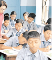
के जिला कार्यक्रम पदाधिकारियों ने रोस्टर क्लियरेंस की जानकारी शेयर की है। नियुक्ति के लिए सभी जिलों से आए रोस्टर क्लियरेंस रिपोर्ट को सामान्य प्रशासन विभाग को भेजा गया था। सामान्य प्रशासन विभाग ने इसकी समीक्षा की तो उसमें विसंगतियां मिलीं। उन्हीं विसंगतियों को बैठक में पदाधिकारियों के समक्ष समक्ष रखा गया। कई जिलों के रोस्टर क्लियरेंस सही कराए। कई जिलों को सुधारने का समय भी दिया गया।

नवबिहार टाइम्स ब्यूरो पटना। चौथे चरण की शिक्षकों की नियुक्तियों को लेकर रोस्टर क्लियरेंस का कार्य पूरा हो चुका है। सभी 38 जिलों से प्राप्त रिक्तियों को लेकर एक प्रस्ताव तैयार किया जा रहा है। करीब 30 हजार पदों पर नियुक्ति संबंधी अध्यायना बिहार लोक सेवा आयोग को 14 जनवरी के बाद भेजी जाएगी। इसे लेकर सोमवार को शिक्षा विभाग के मदन मोहन झा सभागार में सभी जिला कार्यक्रम पदाधिकारियों के साथ बैठक हुई। इसमें रिक्तियों को अंतिम रूप देने का निर्णय लिया गया। बैठक में शामिल माध्यमिक शिक्षा निदेशालय के एक अधिकारी ने बताया कि सभी जिलों से शिक्षकों के खाली पदों की रिक्तियां आ गई हैं। अभी जिलेवार रिक्तियों का आकलन किया जा रहा है। कई जिलों के जिला शिक्षा अधिकारी और स्थापना