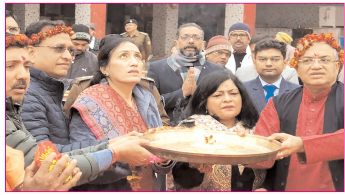
दुमका के बाबा बासुकीनाथ मंदिर में सपरिवार पूजा करते मुख्य चुनाव आयुक्त ज्ञानेश कुमार

* मूल्य : 3.00 रुपये * औरंगाबाद एवं बोकारो से प्रकाशित * www.navbihartime.com