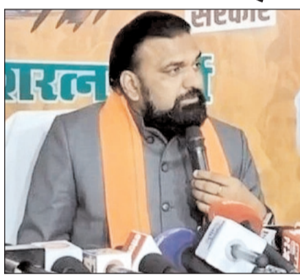
निवेश शामिल है। इनमें से 12 परियोजनाएं, जिनकी लागत 51,833 करोड़ रुपये है, पूरी हो चुकी हैं, जबकि शेष 29 परियोजनाएं 1.62 लाख करोड़ रुपये की लागत से तेजी से प्रगति पर हैं। उपमुख्यमंत्री ने कहा कि बिहार जैसे गरीब राज्य को आगे बढ़ाने के लिए केंद्र

नवबिहार टाइम्स ब्यूरो पटना। विकसित बिहार के लिए राज्य में अभी छह लाख 58 हजार करोड़ की 170 राष्ट्रीय परियोजनाओं पर काम चल रहा है। इनमें से एक लाख 28 हजार करोड़ की 60 परियोजनाएं पूरी कर जनता को समर्पित की जा चुकी हैं, जबकि 5.30 लाख करोड़ की लागत से 110 परियोजनाएं विभिन्न चरणों में निर्माणाधीन हैं। इनमें सड़क एवं राजमार्ग क्षेत्र की सबसे अधिक परियोजनाएं हैं। उपमुख्यमंत्री सम्राट चौधरी ने सोमवार को पांच देशरत्न मार्ग स्थित अपने सरकारी आवास पर आयोजित प्रेस वार्ता में यह जानकारी दी। श्री चौधरी ने बताया कि प्रधानमंत्री ने हाल ही में देशभर के मुख्य सचिवों के साथ प्रगति के माध्यम से बैठक कर 85 लाख करोड़ रुपये से अधिक की परियोजनाओं की समीक्षा की। बिहार की 41 प्रमुख परियोजनाएं भी प्रधानमंत्री की प्रगति प्रणाली के अंतर्गत समीक्षा में हैं। इन परियोजनाओं में कुल 2.13 लाख करोड़ रुपये का