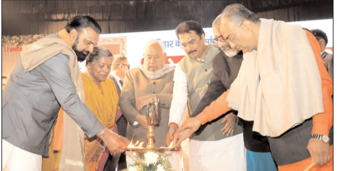
प्रदान की। पूर्व मंत्री नंदकिशोर यादव ने सुशील मोदी के साथ अपने पुराने रिश्ते को याद करते हुए उन्हें एक जुझारू नेता बताया। उन्होंने कहा कि बीजेपी को 'सर्व समाज की पार्टी' बनाने में सुशील मोदी का महत्वपूर्ण योगदान रहा है। उन्होंने कभी अपने विचारों से समझौता नहीं किया। जयंती समारोह में सुशील

नवबिहार टाइम्स ब्यूरो पटना। बिहार के पूर्व उपमुख्यमंत्री पद्मभूषण सुशील कुमार मोदी की जयंती पर सोमवार को श्रीकृष्ण मेमोरियल हॉल में सुशील कुमार मोदी स्मृति शोध संस्थान द्वारा श्रद्धांजलि सभा आयोजित की गई। इस अवसर पर मुख्यमंत्री नीतीश कुमार ने कहा कि बिहार के विकास में सुशील मोदी का महत्वपूर्ण योगदान है। एक सहयोगी के रूप में उन्होंने बेहतर भूमिका निभायी। इस दौरान बीजेपी नेताओं ने कहा कि 'जंगलराज' के दौर में सुशील मोदी ने बिहार में 'चौकीदार' की भूमिका निभाई और राज्य की राजनीति को नई दिशा