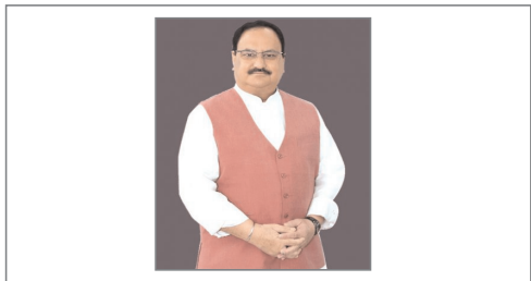
जगत प्रकाश नड्डा

इस विश्व टीबी दिवस पर, मैं इस बात पर बहुत गर्व के साथ विचार करता हूँ कि भारत टीबी के खिलाफ लड़ाई में किस तरह से अपनी रणनीति को फिर से लिख रहा है। हाल ही में संपन्न 1००-दिवसीय सघन टीबी-मुक्त भारत अभियान ने न केवल नवाचार की शक्ति का प्रदर्शन किया है, बल्कि यह भी दिखाया है कि समुदायों को संगठित करना कार्यक्रम संबंधी दृष्टिकोण को बदलने जितना ही महत्वपूर्ण है। यह अभियान 7 दिसंबर 2024 को टीबी के मामलों का पता लगाने में तेजी लाने, मूल्य दर को कम करने और नए मामलों को रोकने के उद्देश्यों के साथ शुरू किया गया था।