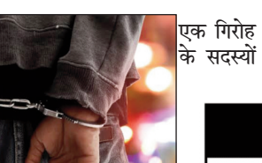
एक गिरोह के सदस्यों

ने अधिर्थियों को सीजीएल के प्रश्नों को देने के नाम पर धन की उगाही की है। इसमें आमजन में सीजीएल प्रश्न पत्र लीक के संबंध में अफवाह व सुगसुगाहट शुरू हो गई थी। अनुसंधान के क्रम में ही यह खुलासा हुआ है कि इस गिरोह का तथाकथित सरगना गोरखपुर का निवासी है। इसके बाद ही इस कांड के अप्राथमिकी आठ अधिभूक्तों को सीआइडी ने सोमवार को गिरफ्तार किया। हालांकि, सीआइडी आगे यह भी कहती है कि अब तक प्रत्यक्ष एवं भौतिक रूप से सीजीएल पेपर के मूल प्रश्न पत्र लीक होने के साक्ष्य नहीं मिले हैं। कांड में आगे के अनुसंधान जारी है।