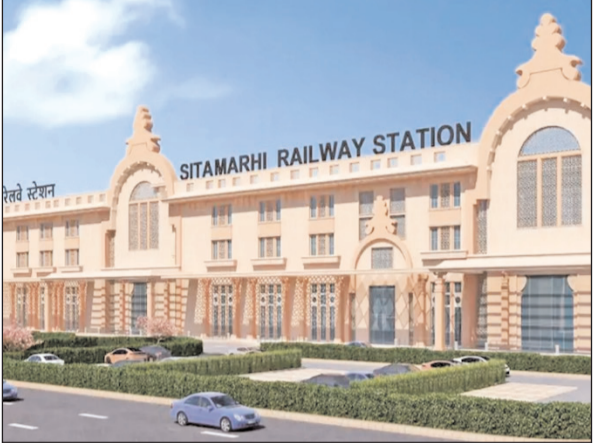
यात्रियों को अत्याधुनिक सुविधाएं देगी, बल्कि जिले के आर्थिक, औद्योगिक और पर्यटन विकास को भी नई गति प्रदान करेगी।

सीतामढ़ी। मां सीता की जन्मस्थली सीतामढ़ी अब रेलवे विकास के एक नए स्थापित अध्याय की ओर बढ़ रही है। अमृत भारत स्टेशन योजना के तहत सीतामढ़ी रेलवे स्टेशन के पुनर्विकास कार्य में तेजी आ गई है। पहले स्वीकृत 242 करोड़ रुपये की राशि में 13 करोड़ 76 लाख 58 हजार 508 रुपये की बढ़ोतरी के बाद अब इस महत्वाकांक्षी परियोजना की कुल लागत करीब 255 करोड़ रुपये हो गई है। टेंडर प्रक्रिया पूरी कर ली गई है और निर्माण कार्य को निधारित समय सीमा के भीतर पूरा करने की योजना है। यह परियोजना न केवल