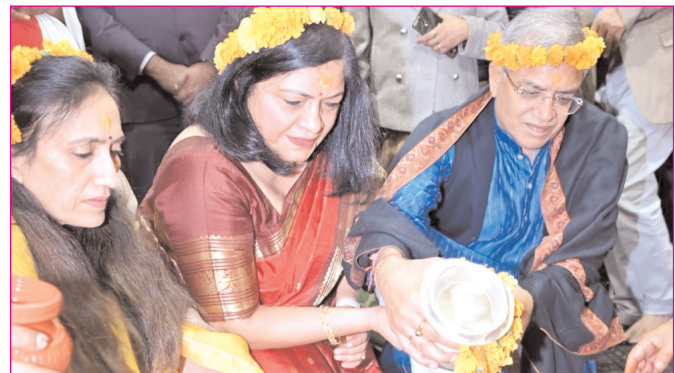
देवघर स्थित बैद्यनाथ मंदिर में पूजा करते मुख्य निर्वाचन आयुक्त ज्ञानेश कुमार और उनकी पत्नी