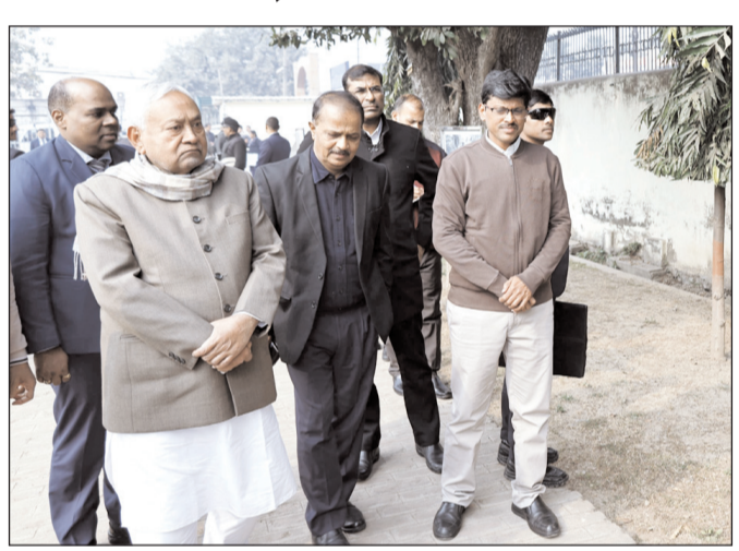
और बेहतर तरीके से विकसित करने के लिए भारत सरकार को पत्र लिखने का निर्देश मुख्यमंत्री ने उपस्थित पदाधिकारियों को दिया। नीतीश कुमार ने

पटना। मगध साम्राज्य के ऐतिहासिक अवशेषों को संरक्षित किए कुम्हार पार्क का शुक्रवार को मुख्यमंत्री नीतीश कुमार ने निरीक्षण किया। पार्क में बुलंदीबाग उत्खनन, कुम्हार उत्खनन, मौर्यकालीन अस्सी स्तंभों वाले विशाल कक्ष आदि के प्रदर्शित मॉडल को देखने के दौरान इससे जुड़ी जानकारीयों से अवगत हुए। मुख्यमंत्री ने कृष्णदेव स्मृति सभागार स्थित पाटलीपुत्र दीर्घा में कुम्हार की मौर्य वास्तुकला, भौतिक सांस्कृतिक आयाम, कुम्हार उत्खनन संबंधी भग्नावशेष, पाटलीपुत्र की कला, संस्कृतियों के प्रभाव आदि से जुड़ी चित्र प्रदर्शनी को देखा। भारतीय पुरातत्व सर्वेक्षण विभाग के अधीन इस पार्क को