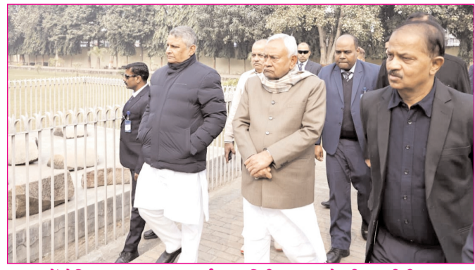
पटना में ऐतिहासिक कुम्हार पार्क का निरीक्षण करते सीएम नीतीश कुमार

* मूल्य : 3.00 रुपये * औरंगाबाद एवं बोकारो से प्रकाशित * www.navbihartime.com