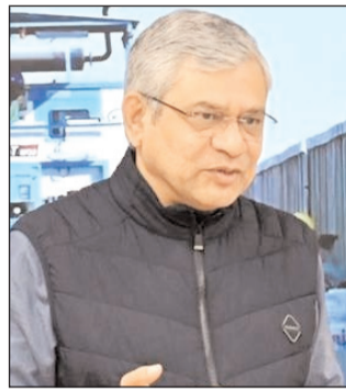
किलोमीटर से अधिक लंबाई वाली सात महाराष्ट्र में हैं। बुलेट परियोजना में 350 मीटर लंबी एक सुरंग गुजरात में स्थित है। श्री वैष्णव ने कहा कि बुलेट ट्रेन से रोजगार सृजित हो रहे हैं और इसके परिचालन के दौरान आर्थिक गतिविधियों को बढ़ावा मिलेगा और अतिरिक्त

शॉटक्रेट, रॉक बोल्ट और लैटिस गर्डर जैसे सहायक प्रणालियां प्रयुक्त की जा सकती हैं। सुरंग निर्माण के दौरान, वायु-संचार, अग्नि सुरक्षा उपाय और उचित प्रवेश और निकास व्यवस्था सहित सभी आवश्यक सुरक्षा सावधानियों का पालन किया गया। इससे पहले, ठाणे और बांद्रा कुर्ला कॉम्प्लेक्स के बीच लगभग 5 किलोमीटर लंबी पहली भूमिगत सुरंग का निर्माण सितंबर 2025 में पूरा हुआ था। मुंबई-अहमदाबाद हाई स्पीड रेल परियोजना कुल 508 किलोमीटर लंबी है, जिसमें सुरंगों की कुल लंबाई 27 दशमलव 4 किलोमीटर है। इनमें से 21 किलोमीटर भूमिगत सुरंगें और 6 दशमलव 4 किलोमीटर सतही सुरंगें हैं। परियोजना में आठ पर्वतीय सुरंग भी शामिल हैं, जिनमें कुल 6 दशमलव 05