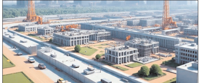
अधिग्रहण की प्रक्रिया शुरू होने वाली है। यह फिनटेक सिटी पूरी तरह से इंडस्ट्रियल कैम्पस के रूप में विकसित की जाएगी। यहां आईटी कंपनियों, बैंकिंग और फाइनेंस संस्थान, फिनटेक स्टार्टअप्स, हाईटेक मैनुफैक्चरिंग यूनिट्स और इन्वेंशन हब एक ही परिसर में मौजूद होंगे। सरकार का लक्ष्य राज्य में वित्त, बीमा, बैंकिंग और टेक्नोलॉजी से जुड़ी कंपनियों को आकर्षित करना और युवाओं के लिए बड़े पैमाने पर रोजगार के अवसर पैदा

पटना। बिहार में औद्योगिक विकास को नई रफ्तार देने के लिए सरकार दो बड़े और रणनीतिक प्रोजेक्ट पर तेजी से काम शुरू करने जा रही है। एक ओर राजधानी पटना को टेक्नोलॉजी और फाइनेंस हब बनाने की योजना है वहीं दूसरी ओर राज्य को रक्षा उत्पादन के बड़े केंद्र के रूप में विकसित करने की तैयारी चल रही है। इन दोनों परियोजनाओं से न सिर्फ निवेश बढ़ेगा बल्कि लाखों युवाओं के लिए रोजगार के नए दरवाजे भी खुलेंगे। नई सरकार के गठन के साथ ही, पटना में गुजरात की गिफ्ट सिटी की तर्ज पर अत्याधुनिक फिनटेक सिटी बनाने की कवायद तेज हो गई है। इसके लिए पटना जिले के फतुहा अंचल के जैतिहा मौजा में 242 एकड़ जमीन को चिह्नित किया गया है। सरकार ने भूमि अधिग्रहण के लिए 408.81 करोड़ रुपये की स्वीकृति दे दी है और जल्द ही