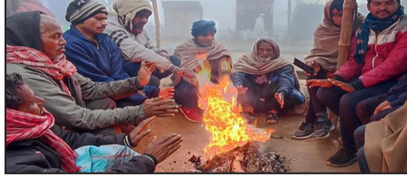
सूत्र पड़ रही हैं। बर्फाली हवाएं शरीर को भेद रही हैं। इस भीषण ठंड का सबसे ज्यादा असर दैनिक मजदूरों करने वाले वर्ग पर पड़ा है। अत्यधिक कोहरे और हाथ जमा देने वाली ठंड के कारण मजदूरों के लिए खुले आसमान के नीचे काम करना लगभग नामुमकिन हो गया है। निर्माण कार्यों से लेकर कृषि कार्यों तक, हर जगह सत्राटा पसरा हुआ है। सोमवार को तापमान अधिकतम 17 व न्यूनतम 9 डिग्री सेल्सियस दर्ज किया गया। प्रचंड ठंड से बचने के लिए लोग अब बिजली के हीटर और पारंपरिक अंगीठी का सहारा ले रहे हैं। बच्चों और बुजुर्गों की सेहत को ध्यान में रखते हुए चिकित्सकों ने उर्ध्व घरों के भीतर ही रहने की सलाह दी है। प्रशासन ने भी जगह-जगह अलवार की व्यवस्था के निर्देश दिए हैं ताकि बेघर और राहगीरों को राहत मिल सके।

नवबिहार टाइम्स ब्यूरो औरंगाबाद। इन दिनों भीषण शीतलहर और कड़क की ठंड से लोगों का बुरा है। आसमान में छाए घने कोहरे और बर्फाली हवाओं ने आम जनजीवन की रफ्तार पर ब्रेक लगा दिया है। सोमवार को भी पूरे दिन सूर्य देव के दर्शन नहीं हुए। शाम होते-होते बर्फाली हवाएं चलने लगीं और कड़क की ठंड से बचाव के लिए लोग घरों में दुबक गए। भूप न निकलने से जानवरों का भी बुरा हाल है। सड़कें खाली-खाली नजर आईं। पिछले कई दिनों से मौसम का मिजाज खराब चल रहा है। जिले में न्यूनतम तापमान गिरकर 9 डिग्री सेल्सियस तक पहुंच गया है, जिससे लोग घरों में दुबकने को मजबूर हैं। गर्म मोजे और भारी जूते पहनने के बावजूद लोगों के पैरों की उंगलियां