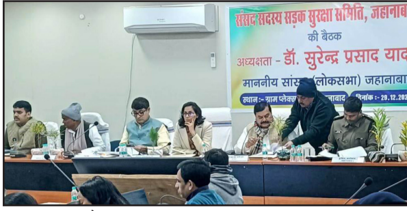
सांसद साहस्य सड़क सुरक्षा समिति, जहानाबाद की बैठक। अध्यक्षता - डॉ. सुरेन्द्र प्रसाद यादव।

जाया। उक्त बैठक में 4ई अर्थात् शिक्षा एवं जन जागरूकता, कानून प्रवर्तन, सड़क अभियांत्रिकी सुधार, आपातकालीन चिकित्सा एवं राहत पर भी व्यापक चर्चा किया गया। बैठक में जिलाधिकारी एवं सांसद ने कई प्रमुख निर्देश दिए जिसमें - सड़क दुर्घटनाओं में कमी हेतु ब्लैक स्पॉट्स की पहचान कर त्वरित सुधारमात्रक कार्रवाई सुनिश्चित की जाए। ओवरस्पीडिंग, शराब पीकर वाहन चलाने एवं बिना हेलमेट/सीट बेल्ट के विरुद्ध विशेष प्रवर्तन अभियान चलाया जाए। विद्यालय वाहनों की नियमित जांच, फिटनेस, ड्राइवर सत्यापन एवं वाहन पर अनिवार्य संकेतकों का अनुपालन सुनिश्चित किया जाए। राष्ट्रीय/राज्य राजमार्गों एवं प्रमुख जिला मार्गों पर संकेतक, रिफ्लेक्टर,