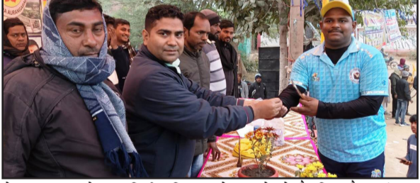
क्षेत्र रक्षण करने का निर्णय लिए। पहले खेलते हुए बहादुर विगहा की टीम ने सभी विकेट खोकर 163 रन का बड़ा स्कोर खड़ा किया। जबकी पुरा खेलने उठते हिरेदेचक की टीम ने सभी विकेट खोकर 100 रन पर 50 रन पर ही सिमट गया। मैच में बहादुर विगहा की टीम 113 रन से जीत दर्ज कर सेमिफाइनल में खेलने के लिए जगह बना ली। पूरे मैच में