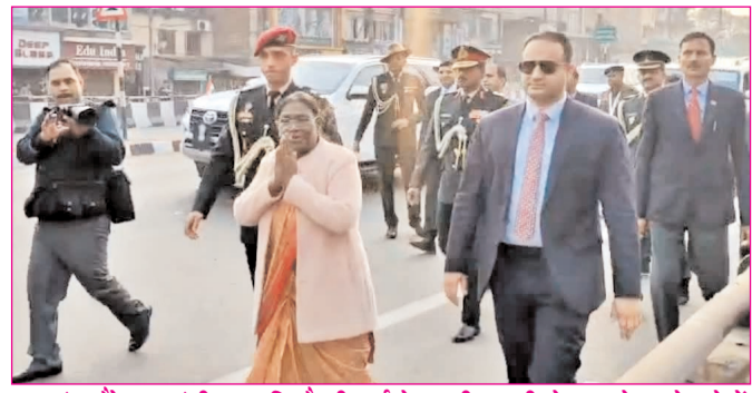
झारखंड दौरे पर पहुंची राष्ट्रपति द्रौपदी मुर्मू ने अपनी सादगी से सरायकेला के लोगों का दिल जीत लिया। प्रोटोकॉल छोड़ वह बीच सड़क पर लोगों से मिलने पहुंचीं।