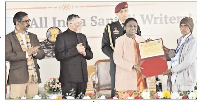
जमशेदपुर में एक समारोह के दौरान ओलचिकी लिपि भाषा को आगे बढ़ाने में योगदान देने वाले को सम्मानित करती राष्ट्रपति द्रौपदी मुर्मू