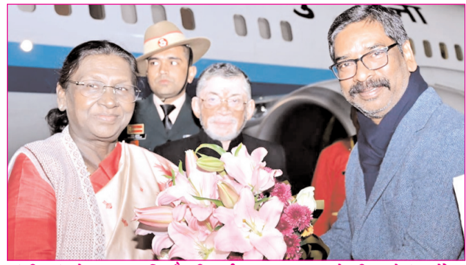
रांची पहुंचने पर राष्ट्रपति द्रौपदी मुर्मू का स्वागत करते सीएम हेमंत सोरेन