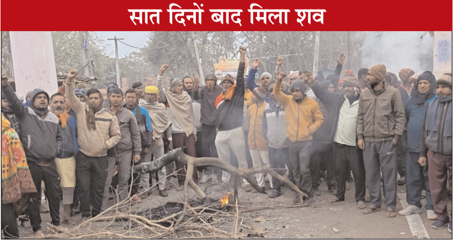
सात दिनों बाद मिला शव