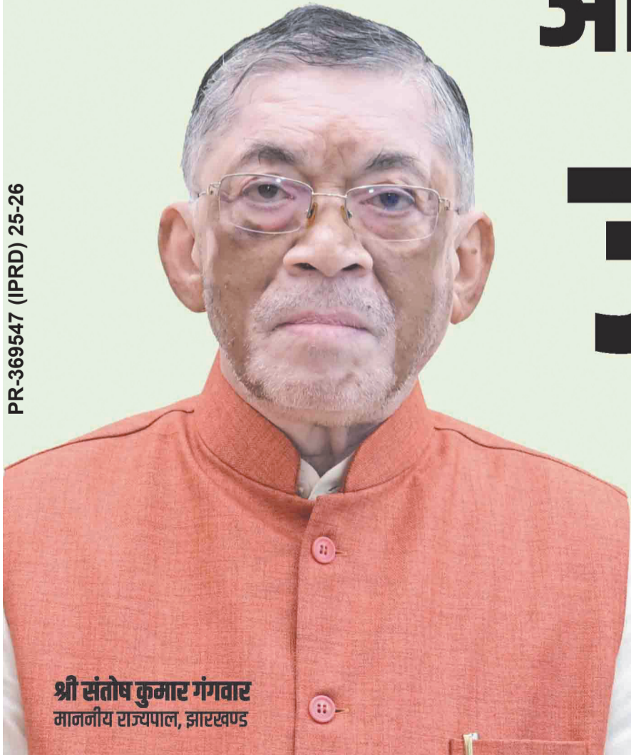
श्री संतोष कुमार गंगवार माननीय राज्यपाल, झारखण्ड