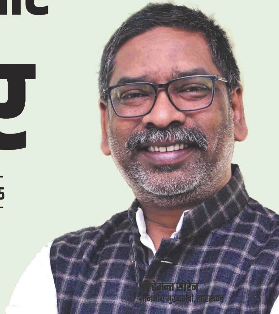
हेमन्त सोरेन माननीय मुख्यमंत्री, झारखण्ड