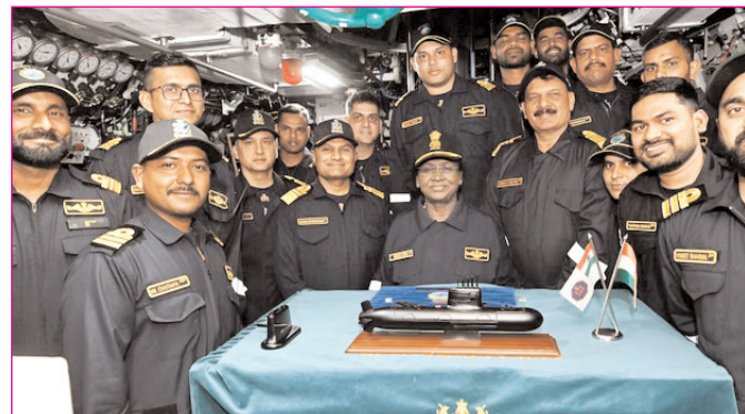
राष्ट्रपति द्रौपदी मुर्मू ने की नौसेना की पनडुब्बी आइएनएस वाघशीर की यात्रा

* औरंगाबाद एवं बोकारो से प्रकाशित * www.navbihartime.com