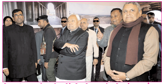
बिहार संग्रहालय के सामने पुनर्विकसित किए जा रहे अफिसर्स हॉस्टल कैम्पस के निर्माण कार्य की प्रगति की जानकारी लेते मुख्यमंत्री नीतीश कुमार

* पटना संस्करण * रजि. नंबर : 52290/90 * वर्ष : 36 * अंक : 211 * पृष्ठ : 12 * औरंगाबाद, रविवार, 28 दिसम्बर 2025 * मूल्य : 3.00 रुपये * औरंगाबाद एवं बोकारो से प्रकाशित * www.navbihartime.com