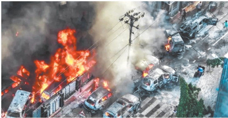
घटनाओं की पुनरावृत्ति यह दर्शाती है कि संवेदी सेवाओं, प्रशासनिक संरक्षण, और सामाजिक सहभागिता की आवश्यकता पहले से कहीं ज्यादा बढ़ गई है।

असल में बांग्लादेश का संविधान धर्मनिरपेक्षता की बात तो करता है जो कि सराहनीय है और आदर्श भी है, लेकिन किसी भी संविधान की आत्मा उसकी किताबों में नहीं, बल्कि समाज के व्यवहार में बसती है। अमूमन देखा जाता है कि जब किसी देश में अल्पसंख्यकों को बार-बार अपनी सुरक्षा, अपनी आस्था और अपनी पहचान के लिए संघर्ष करना पड़े, तो यह उस व्यवस्था की विफलता का संकेत होता है। इसी के साथ एक यह भी सत्य है कि बांग्लादेश की आम जनता का एक बड़ा हिस्सा शांति और सह-अस्तित्व में विश्वास करता है। लेकिन समस्या तब पैदा होती है जब कट्टर तत्वों को राजनीतिक संरक्षण, सामाजिक मौन और प्रशासनिक उदासीनता मिल जाती है। तब हिंसा केवल अपराध नहीं रह जाती, वह एक संदेश बन जाती है और वह संदेश होता है, डर का संदेश।