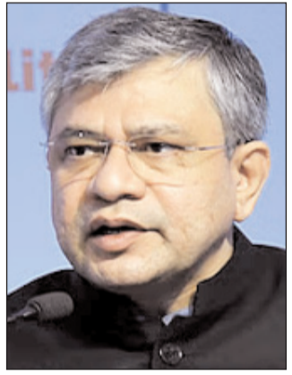
की संचालन क्षमता बढ़ाने की योजना बनाने समय यह सुनिश्चित किया जाएगा कि न केवल टर्मिनल क्षमता में वृद्धि हो,

के लिए नियोजित, प्रस्तावित या पहले से स्वीकृत कार्यों को शामिल किया जाएगा। क्षमता को वर्ष 2030 तक दोगुना करने की योजना है, लेकिन यह आशा है कि अगले 5 वर्षों में क्षमता में क्रमिक वृद्धि की जाएगी ताकि क्षमता वृद्धि के लाभ तुरंत प्राप्त किए जा सकें। इससे आने वाले वर्षों में यातायात की बढ़ती आवश्यकता को पूरा करने में सहायता मिलेगी। योजना में कार्यों को तीन श्रेणियों, अर्थात् तत्काल, अल्पकालिक और दीर्घकालिक में वर्गीकृत किया जाएगा। प्रस्तावित योजनाएं विशिष्ट हॉंगी, जिनमें स्पष्ट समयसीमा और परिभाषित परिणाम होंगे। यद्यपि यह अभ्यास विशिष्ट स्टेशनों पर केंद्रित है किन्तु रेल गाड़ियों