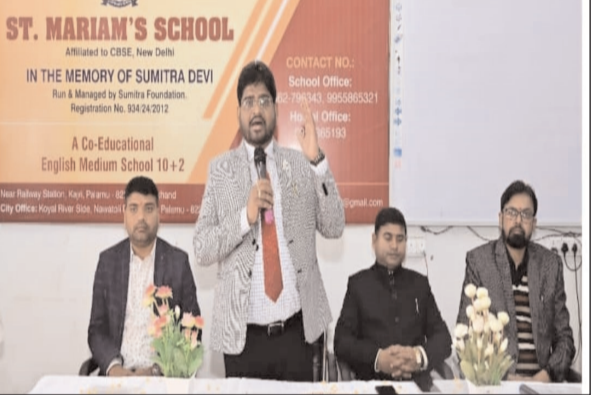
नवबिहार टाइम्स संवाददाता

स्कूल के आवासीय परिसर में आगामी शैक्षणिक सत्र का किया गया शुभारंभ