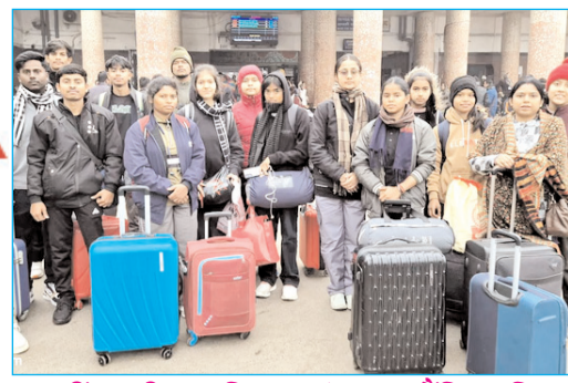
31वीं राष्ट्रीय जूनियर थांग-ता चैंपियनशिप के लिए झारखंड का दल गुवाहाटी रवाना