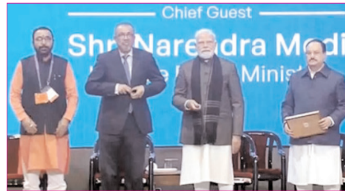
नई दिल्ली में पीएम मोदी ने नई डब्ल्यूएचओ-साउथ ईस्ट एशियाई क्षेत्रीय कार्यालय कोमलेस का उद्घाटन किया