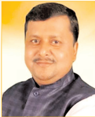
जयप्रकाश नारायण के नेतृत्व में गैर कांग्रेसवाद की ओर चल पड़ा। कायस्थ समुदाय दोबारा कांग्रेस की ओर नहीं मिला। बाद में भारतीय जनता पार्टी के

कुसी तक पहुंचे। लेकिन कांग्रेस और कायस्थों के गठजोड़ को तब झटका लगा जब जयप्रकाश नारायण ने खुलेआम कांग्रेस को सत्ता से हटाने के आंदोलन का नेतृत्व संभाला और तब पूरा का पूरा कायस्थ समाज कांग्रेस से कटकर गैर कांग्रेसवादी राजनीति में शामिल हो गया। यह बात अलग है कि 1977 में जब सत्ता में परिवर्तन हुआ तो कायस्थ समाज को वह हिस्सेदारी या सम्मान प्राप्त नहीं हुआ जो उसे कांग्रेस के राजपाट में मिलता था। बिहार में उग्र पिछड़ावाद के उभार ने कायस्थों को हाशिये पर धकेल दिया। 1980 के चुनाव में स्थितियां बदल गईं और कांग्रेस फिर से सत्ता में आ गई लेकिन