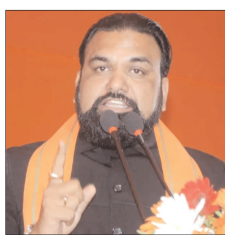
सम्राट चौधरी ने शुक्रवार को पुलिस मुख्यालय सभागार में आयोजित कार्यक्रम में यह बातें कहीं। कार्यक्रम में बिहार पुलिस के 36 दिवंगत पुलिस पदाधिकारियों एवं कर्मियों के आश्रितों को बैंक आफ बड़ौदा के सैलरी पैकेज के तहत कुल 25 करोड़ 65 लाख रुपये की बीमा एवं अनुदान राशि का चेक बैंक प्रदान किया गया।

पटना। राज्य के सभी पुलिस लाइनों में आवासीय विद्यालय खोले जाएंगे। यहां पुलिसकर्मियों के बच्चों को पढ़ाई, ड्रेस और अन्य आवश्यक सुविधाएं उपलब्ध कराई जाएंगीं। इसके साथ ही पटना की तर्ज पर सभी पुलिस लाइन में जल्द ही पुलिसकर्मियों के लिए जीविका दीदी की रसोई भी चलेगी। उपमुख्यमंत्री (गृह) सम्राट चौधरी ने शुक्रवार को पुलिस मुख्यालय सभागार में आयोजित कार्यक्रम में यह बातें कहीं। कार्यक्रम में बिहार पुलिस के 36 दिवंगत पुलिस पदाधिकारियों एवं कर्मियों के आश्रितों को बैंक आफ बड़ौदा के सैलरी पैकेज के तहत कुल 25 करोड़ 65 लाख रुपये की बीमा एवं अनुदान राशि का चेक बैंक प्रदान किया गया। सम्राट चौधरी ने कहा कि यह कार्यक्रम भावुक कर देने वाला है क्योंकि यहां उपस्थित कई परिवारों ने अपने प्रियजनों को खोया है। आज जिन 36 पुलिसकर्मियों के परिजनों को बीमा राशि वितरित की गई है, इनमें से 12 पुलिसकर्मियों की मृत्यु दुर्घटना में जबकि 24 की मृत्यु गंभीर बीमारियों के कारण हुई