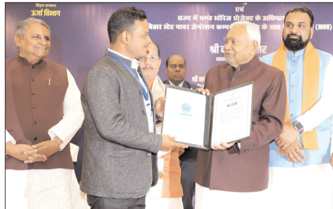
मुख्यमंत्री ने कहा कि 2005 से वर्ष 2020 के बीच 8 लाख से अधिक युवाओं को सरकारी नौकरी दी गयी। वर्ष 2020 में सात निश्चय-2 के तहत 10 लाख नौकरी एवं 10 लाख रोजगार देना तय किया गया था जिसके तहत हमलागों

पटना। मुख्यमंत्री नीतीश कुमार ने ऊर्जा विभाग में नवचयनित 2390 लोगों को नियुक्ति पत्र प्रदान किया। इनमें 1810 तकनीशियन, 512 पत्राचार लिपिक तथा 68 भंडार सहायक कर्मी शामिल हैं। यह नियुक्ति बिहार स्टेट पावर (होल्टिंग) कंपनी लिमिटेड एवं उनसे संबद्ध कंपनियों के लिए की गयी है। मंगलवार को विद्युत भवन में आयोजित कार्यक्रम में मुख्यमंत्री नीतीश कुमार ने नियुक्ति पत्र पानेवाले सभी लोगों को बधाई एवं शुभकामनाएं दीं। उन्होंने कहा कि आप सभी से उम्मीद करता हूं कि पूरी मेहनत और लगन से काम करेंगे तथा बिहार को और आगे बढ़ावेंगे। उन्होंने कहा कि हमलागों के द्वारा शुरू से ही युवाओं को सरकारी नौकरी एवं रोजगार उपलब्ध कराया जा रहा है।