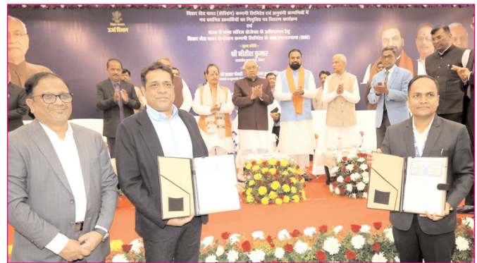
बिहार में पम्प स्टोरज प्रोजेक्ट के अधिष्ठापन हेतु एकरानामे पर हस्ताक्षर किया गया

* मूल्य : 3.00 रुपये * औरंगाबाद एवं बोकारो से प्रकाशित * www.navbihartime.com