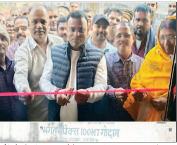
बिचौलियों की भूमिका समाप्त होगी। कार्यक्रम के प्रति आधार प्रकट करते हुए किसानों से अपील की कि वे अधिक से अधिक संख्या में धान क्रय केंद्र का लाभ उठाएं।