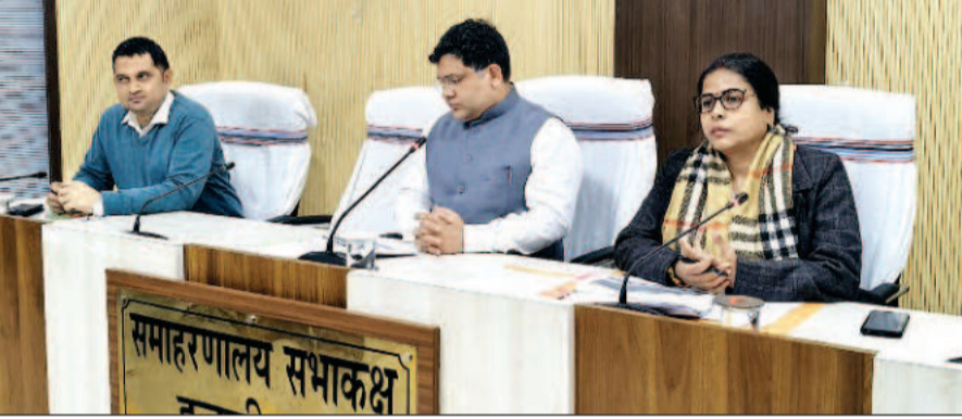
तहत प्रभावित क्षेत्रों में आकलन कर संभावित कार्यों एवं स्वीकृत योजनाओं की सूची उपलब्ध कराने का भी निर्देश दिया। इसके अतिरिक्त क्षेत्रीय स्तर पर लंबित कार्यों को स्थानीय प्रशासन के सहयोग से पूर्ण

बैठक के दौरान उपायुक्त ने विभिन्न विभागों के पदाधिकारियों एवं कंपनियों के प्रतिनिधियों को उनके अंतर्गत संचालित योजनाओं से संबंधित आय-व्यय की संपूर्ण जानकारी उपलब्ध कराने का निर्देश दिया। साथ ही सभी कंपनियों को अपने-अपने सीएसआर बजट एवं पोषण (व्यय की स्थिति) की विस्तृत जानकारी आगामी गुरुवार तक उपलब्ध कराने का निर्देश दिया गया। उपायुक्त ने शिक्षा विभाग के पदाधिकारियों को सीएसआर मद के