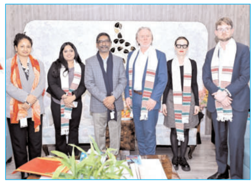
झारखंड के सीएम हेमंत सोहन से ऑस्ट्रेलिया के हार्ड कमिश्नर की मुलाकात

भाजपा के नए राष्ट्रीय कार्यकारी अध्यक्ष बनने के बाद दिल्ली पहुंचे नितिन नवीन का अमित शाह और जेपी नड्डा ने किया स्वागत