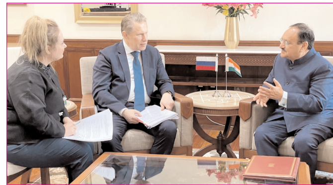
केंद्रीय स्वास्थ्य मंत्री जेपी नड्डा ने आज रूस के स्वास्थ्य मंत्री से मुलाकात की

* मूल्य : 3.00 रुपये * औरंगाबाद एवं बोकारो से प्रकाशित * www.navbihartime.com