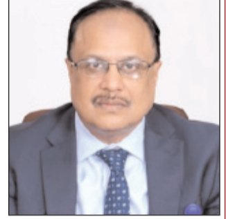
सहायक प्रशासनिक अधिकारी के रूप में एलआईसी में शामिल हुए थे। उन्होंने वरिष्ठ मंडल प्रबंधक, विपणन और पैपन और समूह योजनाओं के क्षेत्रीय प्रबंधक और अंतरराष्ट्रीय संचालन के लिए एलआईसी की रणनीतिक व्यापार इकाई के कार्यकारी निदेशक सहित कई प्रमुख पदों पर काम किया है।