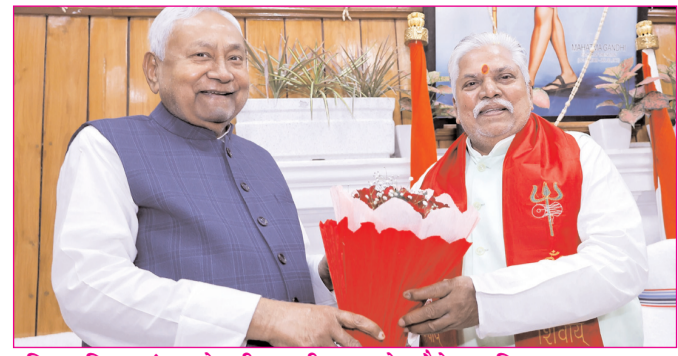
बिहार विधानमंडल के शीतकालीन सत्र के मौके पर विधानसभा अध्यक्ष डॉ. प्रेम कुमार को पुष्प गुच्छ भेंट करते मुख्यमंत्री नीतीश कुमार

* मूल्य : 3.00 रुपये * औरंगाबाद एवं बोकारो से प्रकाशित * www.navbihartime.com