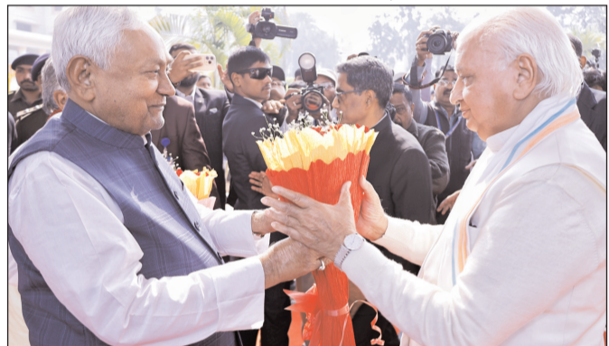
जल्द यह लाभ पहुंचाया जाएगा। उन्होंने केंद्र सरकार और प्रधानमंत्री नरेंद्र मोदी का भी आभार व्यक्त किया, जिन्होंने बिहार के लिए कई महत्वपूर्ण परियोजनाओं की घोषणा की है। राज्यपाल ने कहा कि इस वर्ष के केंद्रीय बजट में मखाना बोर्ड की स्थापना, कई नए हवाईअड्डों के निर्माण और विकास परियोजनाओं के लिए पर्याप्त राशि दी गई है। प्रधानमंत्री द्वारा बिहार के अनेक दौर