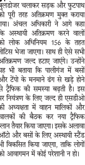
कई लोगों ने सरकारी जमीन पर अवैध निर्माण कर लिया था, जिससे आमजन परेशान थे। इसी समस्या को देखते हुए वरीय पदाधिकारी के निर्देश पर आज अतिक्रमण हटाने की कार्रवाई की गई। उन्होंने बताया कि अतिक्रमण हटाने के लिए एक सप्ताह पहले ही लोगों को सूचना दे दी गई थी, परंतु फिर भी कई लोगों ने कब्जा नहीं हटाया। मजबूर

बुलडोजर चलाकर सड़क और फुटपाथ को पूरी तरह अतिक्रमण मुक्त कराया गया। अंचल अधिकारी ने आगे कहा कि अस्थायी अतिक्रमण करने वालों को लोका अधिनियम 156 के तहत नोटिस भेजा जाएगा। साथ ही ऐसे सभी अतिक्रमण जल्द हटाए जाएंगे। उन्होंने यह भी बताया कि पालीगंज में बसों और टैपों के मनमाने ढंग से खड़े होने से ट्रैफिक की समस्या बढ़ती है। इस पर नियंत्रण के लिए जल्द ही एसडीओ की अध्यक्षता में वाहन मालिकों और चालकों की बैठक कर नया ट्रैफिक प्लान तैयार किया जाएगा। इसके अलावा ऑटो और बसों के लिए अस्थायी स्टैंड भी विकसित किया जाएगा, ताकि लोगों को आवागमन में कोई परेशानी न हो।