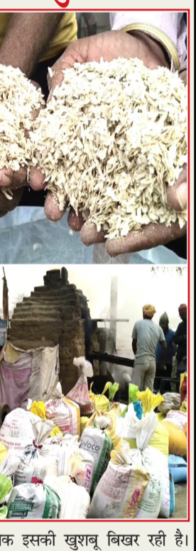
मैं बल्कि विदेशों तक इसकी खुशबू बिखर रही है।

बुलडोजर चलाकर सड़क और फुटपाथ को पूरी तरह अतिक्रमण मुक्त कराया गया। अंचल अधिकारी ने आगे कहा कि अस्थायी अतिक्रमण करने वालों को लोका अधिनियम 156 के तहत नोटिस भेजा जाएगा। साथ ही ऐसे सभी अतिक्रमण जल्द हटाए जाएंगे। उन्होंने यह भी बताया कि पालीगंज में बसों और टैपों के मनमाने ढंग से खड़े होने से ट्रैफिक की समस्या बढ़ती है। इस पर नियंत्रण के लिए जल्द ही एसडीओ की अध्यक्षता में वाहन मालिकों और चालकों की बैठक कर नया ट्रैफिक प्लान तैयार किया जाएगा। इसके अलावा ऑटो और बसों के लिए अस्थायी स्टैंड भी विकसित किया जाएगा, ताकि लोगों को आवागमन में कोई परेशानी न हो।