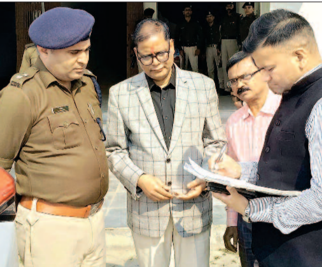
अनुमंडल पुलिस पदाधिकारी सहित अन्य जिला प्रशासन एवं पुलिस प्रशासन की पूरी टीम मौजूद थी।