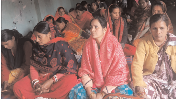
जागरण शिक्षा, संस्कार शिक्षा के

टिकारी। एकल अभियान टिकारी संच की दो दिवसीय मासिक अभ्यास वर्ग का समापन किया गया। ज्ञातव्य हो कि टिकारी स्थित विश्व हिंदू परिषद प्रांगण में दो दिवसीय प्रशिक्षण वर्ग लगाकर आचार्य आचार्यों को पांच आयाम पंचमुखी शिक्षा के बारे में प्रशिक्षित किया गया। पंच मुखी शिक्षा में प्राथमिक शिक्षा, आरोग्य शिक्षा, ग्राम विकास शिक्षा,