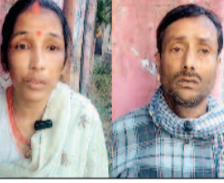
तीन हजार रुपये नगद, पासबुक, अल्ट्रासाउंड रिपोर्ट और अन्य कागजात थे। स्थानीय लोगों का कहना है कि सेन्ट्रल बैंक परिसर अवांजनीय तत्वों का अड्डा बन चुका है। बैंक परिसर में सुरक्षा व्यवस्था शून्य है और पुलिस भी जांच के नाम पर खानापूति करती है। कई कांडों में अब तक न तो उद्देदन हुआ है और न ही पीड़ितों को रकम वापस मिली है।