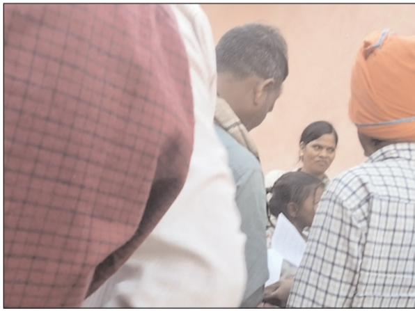
कैनाल खोदने से उनकी उजाऊ भूमि का नुकसान होगा और इसका

गुरुआ। प्रखंड के काज पंचायत अंतर्गत इटवा गांव के समीप उत्तरी कोयल नहर से सिंचाई के लिए निकाली जा रही गम्हरिया माइनर कैनाल की खुदाई को लेकर स्थानीय रैयतों और किसानों में भारी आक्रोश देखा जा रहा है। कैनाल निर्माण की सूचना मिलते ही बड़ी संख्या में ग्रामीण मौके पर जुट गए और परियोजना के खिलाफ विरोध जताया। किसानों का कहना है कि उनकी जमीन से नई नहर की खुदाई पूरी तरह अनावश्यक है। उनका तर्क है कि वे सदियों से उत्तरी कोयल नहर से जुड़ी गंगारिया पड़न