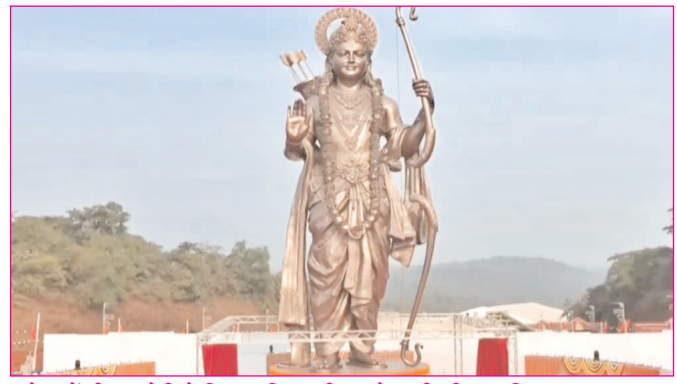
गोवा में पीएम मोदी ने किया दुनिया की सबसे ऊंची श्रीराम प्रतिमा का अनावरण

* मूल्य : 3.00 रुपये * औरंगाबाद एवं बोकारो से प्रकाशित * www.navbihartime.com