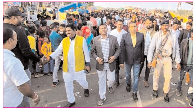
झारखंड के पधुपुर में बुढ़ई नवान्न मेला सह वार्षिक पूजा में उमड़ा आस्था का जन सैलाब

* मूल्य : 3.00 रुपये * औरंगाबाद एवं बोकारो से प्रकाशित * www.navbihartime.com