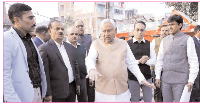
मीठापुर-महली-पुनपुन पथ एवं मीठापुर फ्लाईओवर से चिरैयाटांडा फ्लाईओवर को जोड़ने हेतु पहुंचे पथ एवं सर्विस पथ का निरीक्षण करते मुख्यमंत्री नीतीश कुमार

* मूल्य : 3.00 रुपये * औरंगाबाद एवं बोकारो से प्रकाशित * www.navbihartime.com