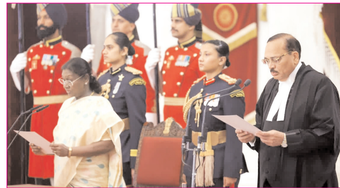
राष्ट्रपति द्रौपदी मुर्मू ने जस्टिस सूर्यकांत को सीजेआइ पर की शपथ दिलाई

* मूल्य : 3.00 रुपये * औरंगाबाद एवं बोकारो से प्रकाशित * www.navbihartime.com