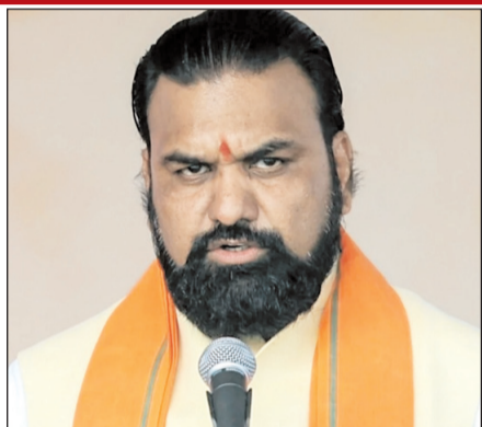
पॉलिसी की चर्चा होती है। योगी मॉडल में पुलिस को खुली छूट दी गई है। फास्ट ट्रैक कोर्ट में सुनवाई कर अपराधियों को सजा दिलाने की व्यवस्था है। दंगाइयों

पटना। अपराधियों की अब खैर नहीं। बिहार से उन्हें बाहर जाना होगा। यह राज्य अपराधियों के लिए नहीं है। गृह विभाग के मंत्री सह उपमुख्यमंत्री सम्राट चौधरी दो टूक यह बात कही है। श्री सम्राट शनिवार को मीडिया से मुखातिब थे। इस दौरान बिहार में योगी मॉडल लागू करने के सवाल पर उन्होंने अपराधियों को स्पष्ट चेतावनी दे दी। उन्होंने कहा कि मुख्यमंत्री नीतीश कुमार ने बिहार में सुशासन स्थापित किया। अराजकता और जंगलराज को समाप्त किया। प्रधानमंत्री नरेंद्र मोदी और सीएम नीतीश कुमार के नेतृत्व में हमें सुशासन की चिंता करनी है। सम्राट चौधरी गृह विभाग संभालने से पूर्व ही क्राइम कंट्रोल पर अपनी रणनीति स्पष्ट कर चुके हैं। वे अक्सर कहते रहे हैं कि अपराधी जेल में रहेंगे या कब्र में। ऐसे में यूपी के सीएम योगी आदित्यनाथ की