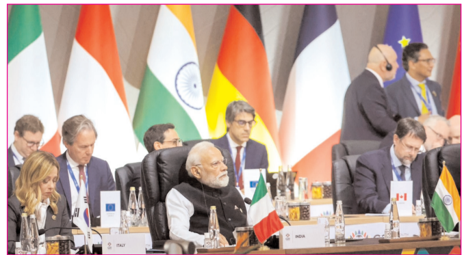
अफ्रीका की धरती पर आयोजित जी20 शिखर सम्मेलन में पीएम नरेंद्र मोदी