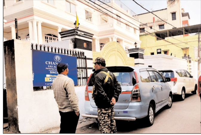
में लेन-देन से जुड़े कई अहम कागजात मिले हैं, जिन्हें एजेंसी ने अपने कब्जे में ले लिया है। झारखंड के धनबाद में 12 स्थानों पर एक साथ छापेमारी की गयी

को वैध दिखाने के लिए फर्जी कंपनियों (शेल कंपनियों) और संदिग्ध बैंक खातों का इस्तेमाल कर रहे हैं। कोलकाता के अलीपुर और तपसिया इलाके में 2 ठिकानों पर एजेंसी के अधिकारियों ने दबिश दी। उत्तर 24 परगना के सल्लेक सेक्टर-2 और एके ब्लॉक में 2 कारोबारियों के ठिकानों पर तलाशी शुरू की। हावड़ा के सलप मोड़ इलाके में भी एक कारोबारी के आवास और दफ्तर की तलाशी चल रही है। ईडी अधिकारियों का कहना है कि इन लोगों का प्रत्यक्ष या परोक्ष संबंध कोयला आपूर्ति और संबंधित ठेकों से है। एजेंसी को शक है कि इन्होंने नेटवर्क के माध्यम से करोड़ों रुपये की अवैध रकम विभिन्न बैंक खातों में भेजी गयी थी। कोलकाता और हावड़ा में जब्त किये गये दस्तावेजों