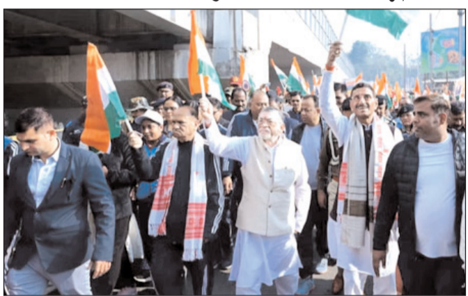
उनकी अद्वितीय दूरदृष्टि, साहस और राष्ट्रनिष्ठा का उदाहरण है। उनका संदेश सदैव यही रहा है कि एकता ही हमारी सबसे बड़ी शक्ति है। उन्होंने यह भी कहा कि युवा कार्यक्रम एवं खेल मंत्रालय तथा 'माई भारत' द्वारा सरदार पटेल की 150वीं जयंती वर्षगांठ को

रांची। राज्यपाल संतोष कुमार गंगवार ने शुक्रवार को राजभवन के मुख्य द्वार से ओटीसी ग्राउंड तक आयोजित 'यूनिटी मार्च-एक भारत, आत्मनिर्भर भारत' में शामिल होकर प्रतिभागियों के मनोबल को बढ़ाया। कार्यक्रम के दौरान उन्होंने सभी प्रतिभागियों को संबोधित करते हुए कहा कि महान स्वतंत्रता सेनानी, आधुनिक भारत के शिल्पकार एवं देश के प्रथम उप प्रधानमंत्री 'लौहपुरुष' भारत रत्न सरदार वल्लभभाई पटेल की 150वीं जयंती वर्षगांठ के अवसर पर आयोजित यह पदयात्रा राष्ट्रीय एकता और सेवा भावना का प्रेरक प्रतीक है। उन्होंने सभी प्रतिभागियों को इस पदयात्रा के लिए हार्दिक शुभकामनाएं दी। राज्यपाल ने कहा कि सरदार पटेल जी ने भारत की 562 रियासतों का विलय कर अखंड भारत की नींव रखी, जो