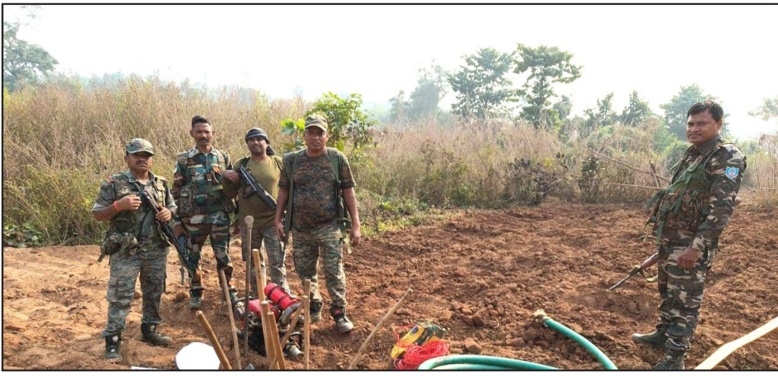
को विधिसम्मत तरीके से जप कर लिया गया है। घटना में संलिप्त फरार व्यक्तियों की पहचान एवं नाम-पता लगाने की कार्रवाई जारी है। नाम

नवबिहार टाइम्स ब्यूरो मेदिनीनगर (पलामू)। पलामू पुलिस को गुप्त सूचना प्राप्त हुई कि मनातू थाना क्षेत्र अंतर्गत ग्राम केदल के पश्चिम स्थित लोहरा थाना के जंगल क्षेत्र में चोरी-छिपे जंगल की कटाई कर अफीम की खेती की तैयारी की जा रही है। सूचना के सत्यापन एवं आवश्यक कार्रवाई हेतु त्वरित रूप से एक छापामारी दल का गठन किया गया तथा सशस्त्र बल के साथ पुलिस टीम उक्त स्थान पर पहुंची। मौके पर पुलिस टीम ने देखा कि कुछ लोग खेत में कार्य कर रहे थे। पुलिस को देखते ही सभी व्यक्ति जंगल एवं झाड़ियों की आड़ लेकर फरार हो गए। छापामारी के दौरान स्थल से अफीम खेती में प्रयुक्त सभी सामग्री एवं औजार बरामद किए गए। बरामद सामग्री सामग्री में आठ किलो डीएपी खाद, पांच किलो यूरिया, कीटनाशक दवा, छह कुदाल, दो टांगी, दो सबल, एक विलियर्स मशीन, एक सक्शन पाइप, एक डिलीवरी पाइप, दो पीस रिंच, व एक पेचकस पाया गया। उपरोक्त सभी सामग्री