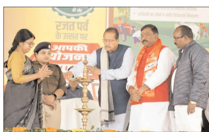
इनकार कर दिया है। वित्त मंत्री ने अधिकारियों की कार्यशाली पर बोलते हुए कहा कि हेमंत सोरेन की तरह ही अधिकारियों को संवेदनशील होकर कार्य करना पड़ेगा। पलामू का इलाका नक्सल प्रभावित है, कार्यशाली से मन भटक सकता है। वित्त मंत्री राधाकृष्ण किशोर ने बताया कि हेमंत सोरेन सरकार संवेदनशीलता के साथ सभी वर्ग के लिए कार्य कर रही है। यह

मेदिनीनगर। पलामू जिले में सेवा अधिकार सप्ताह के मौके पर वित्त मंत्री राधाकृष्ण किशोर ने कहा कि झारखंड में टेंडर का नियम बदल जाएगा। टेंडर के नियम में बदलाव का मामला कैबिनेट में उठाया जाएगा। न्यूनतम बोली 10 प्रतिशत ही नीचे जा सकती है। इस बात की घोषणा उन्होंने पलामू के लेस्लीगंज में की है। दरअसल पलामू से ही पूरे झारखंड में आपकी योजना आपकी सरकार आपके द्वार कार्यक्रम के तहत सेवा अधिकार सप्ताह की शुरुआत हुई है। वित्त मंत्री राधाकृष्ण किशोर ने कार्यक्रम के दौरान केंद्र सरकार पर कई गंभीर आरोप लगाए। वित्त मंत्री ने कहा कि केंद्र सरकार नवंबर तक झारखंड को मिलने वाले 30 करोड़ रुपये की ज्यादा करक्यूमिन कंटेंट, चमकीले रंग और खुशबूदार गुणों के लिए जानी जाने वाली यह हल्दी अपनी क्वालिटी में अनोखी है और इसे आदिवासी किसान आर्थिक तरीके से उगाते हैं।