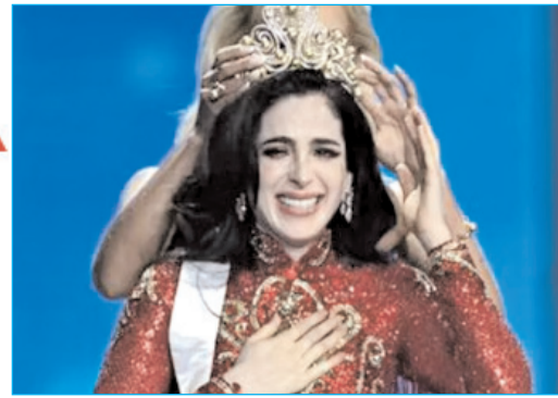
मेक्सिको की फातिमा बॉश के सिर सजा मिस यूनीवर्स का ताज