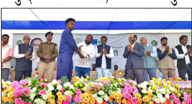
शॉर्टकट नहीं होता, बस लगातार लगन और मेहनत से ही सफलता मिलती है। कड़ी मेहनत ही सफलता की चाबी है। विधायक ने कहा, "आज आप ट्रेनिंग का सर्टिफिकेट लेकर आ रहे हैं। यह आपकी जिंदगी में सफलता की ओर पहला कदम है।" वहां मौजूद लोगों को संबोधित करते हुए, विधायक ने उनसे अपने गांव के लिए एक