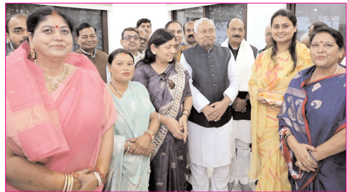
पटना में जनप्रतिनिधियों, नेताओं एवं कार्यकर्ताओं से मिलते सीएम नीतीश

* मूल्य : 3.00 रुपये * औरंगाबाद एवं बोकारो से प्रकाशित * www.navbihartime.com