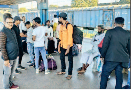
कुल 287 यात्रियों से अनियमित या बिना टिकट यात्रा करने के मामलों में कार्रवाई करते हुए 2,52,445/- का जुमाना वसूल कर रेलवे को महत्वपूर्ण राजस्व लाभ पहुंचाया गया। रेल मंडल प्रशासन ने इस