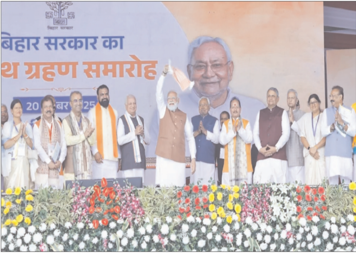
नीतीश कुमार की 10वीं बार ताजपोशी के मौके पर पटना के ऐतिहासिक गांधी मैदान के आयोजित समारोह में राजनीति के धुरधरों की रही उपस्थिति ।