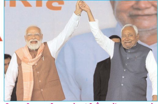
बिहार की राजधानी पटना के गांधी मैदान में शपथ ग्रहण के बाद प्रधानमंत्री नरेन्द्र मोदी एवं मुख्यमंत्री नीतीश कुमार