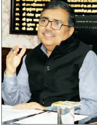
जरीडीह क्षेत्र में एफपीओ का निबंधन 10 दिनों के अंदर करें पूरा- उपायुक्त अजय नाथ झा ने जिला कृषि पदाधिकारी को निर्देश दिया कि जरीडीह प्रखंड क्षेत्र में एफपीओ फार्मर प्रोड्यूसर ऑर्गेनाइजेशन का निबंधन 10 दिनों के अंदर पूरा करने को

सांस्कृतिक दलों द्वारा प्रस्तुति सुनिश्चित करें- उपायुक्त अजय नाथ झा ने धान कटनी उत्सव व्यापक रूप से मनाने का निर्देश दिया। इसमें सांस्कृतिक दलों एवं नुकड़ नाटक की टीम की सेवाएं लेने हेतु निर्देशित किया। उन्होंने कहा कि देश की तरक्की में किसानों का अहम योगदान है। ऐसे में उनके साथ किसी भी स्तर से धोखाधड़ी बर्दाश्त नहीं की जाएगी। उन्होंने किसानों को उनके उपज का उचित मूल्य मिले संबंधित अधिकारी से सुनिश्चित करें। साथ ही उन्होंने कहा कि जिले के सभी प्रखंडों के प्रखंड विकास पदाधिकारी प्रत्येक पैकसों के निगंत्रित पदाधिकारी होंगे। साथ ही उन्होंने कहा कि कृषि कार्य से संबंधित सभी विभाग आपस में समन्वय के साथ कार्य करें ताकि बेहतर परिणाम दिया जा सके।