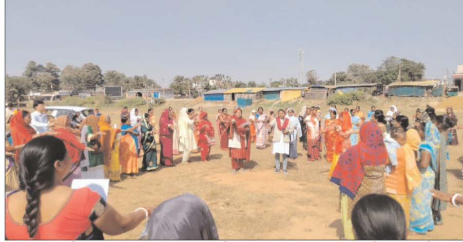
सड़क संपर्क जैसी सुविधाओं में उल्लेखनीय सुधार हुआ है। परिवारों की आर्थिक स्थिति में भी महत्वपूर्ण बदलाव आया है। अगले 5 वर्षों की सपनों की रूपरेखा दीदियों ने आपसी विचार-विमर्श के दौरान गांव और अपने परिवार के अगले 5 वर्षों के लक्ष्यों को साझा किया।

25 वर्षों के बदलाव पर चर्चा- कार्यक्रम के दौरान विगत 25 वर्षों में गांव में आए सकारात्मक परिवर्तनों पर विस्तृत चर्चा की गई। दीदियों ने साझा किया कि-पहले गांव में बिजली, पानी, शौचालय और सड़क जैसी मूलभूत सुविधाएँ सीमित थीं। अब स्वयं सहायता समूहों से जुड़ने के बाद न केवल सामाजिक व आर्थिक सशक्तिकरण बढ़ा है बल्कि गांव में बिजली आपूर्ति, स्वच्छ पेयजल, शौचालय निर्माण, और