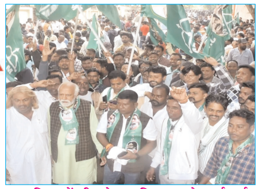
घाटशिला में जीत से उत्साहित झामुमो कार्यकर्ता