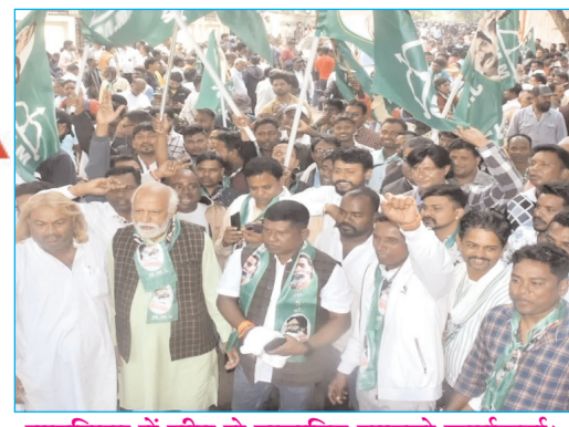
घाटशिला में जीत से उत्साहित झामुमो कार्यकर्ता।

बोकारो, शनिवार 15 नवम्बर 2025 • वर्ष : 09 • अंक : 178 • पृष्ठ : 12 • मूल्य : 3.00 रु. • RNI No. : JHAHIN2017/72655 • बोकारो व औरंगाबाद से प्रकाशित