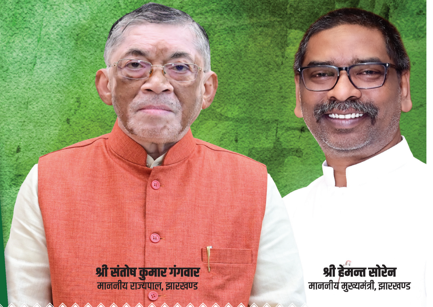
श्री संतोष कुमार गंगवार माननीय राज्यपाल, झारखण्ड

लेकिन उनके उलगुलान का संदेश थमा नहीं। बिरसा मुंडा समेत वीर पुरखों के आदर्शों पर चल कर लंबे संघर्ष और बलिदान के बाद आंदोलनकारियों ने झारखण्ड अलग राज्य का सपना पूरा किया। आज धरती आबा का युवा झारखण्ड हम सभी के समक्ष है।