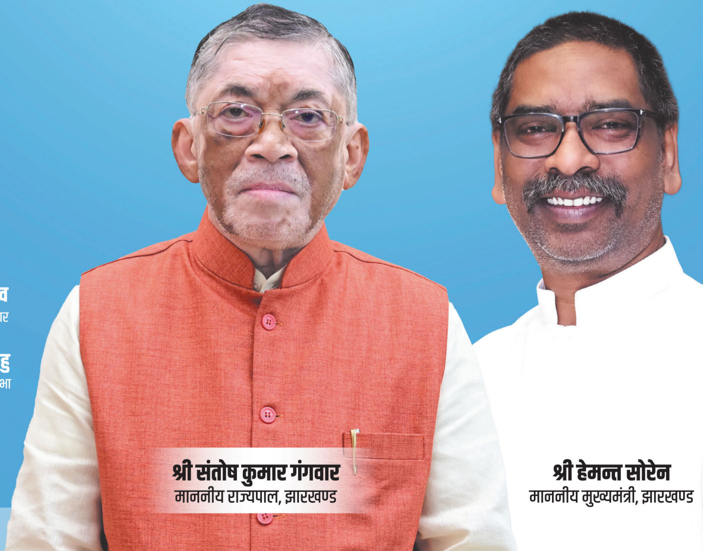
श्री संतोष कुमार गंगवार माननीय राज्यपाल, झारखण्ड