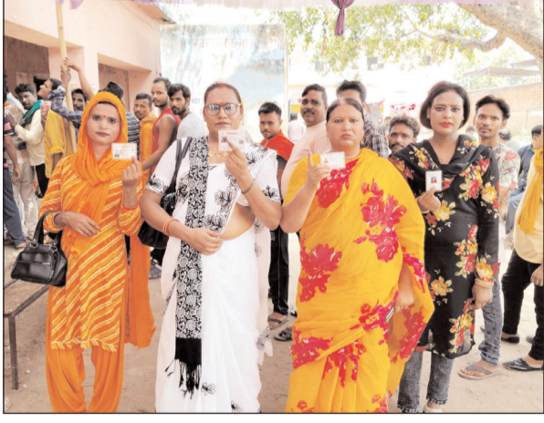
रोहतास में किन्नर समाज ने किया मतदान