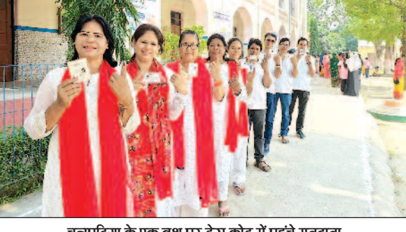
चनपटिया के एक बुध पर ड्रेस कोड में पहुंचे मतदाता