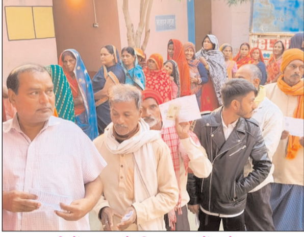
मधुबनी में मतदान के लिए कतार में खड़े मतदाता