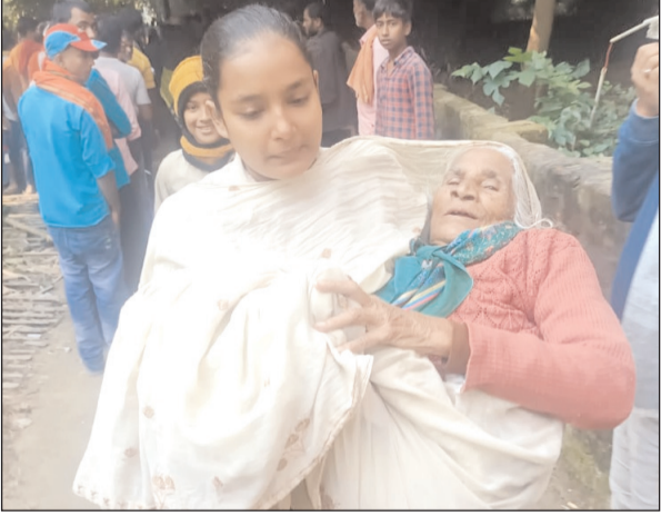
शिवहर में बुजुर्ग मतदाता ने किया वोट, महिला पुलिस ने गोद में उठाया