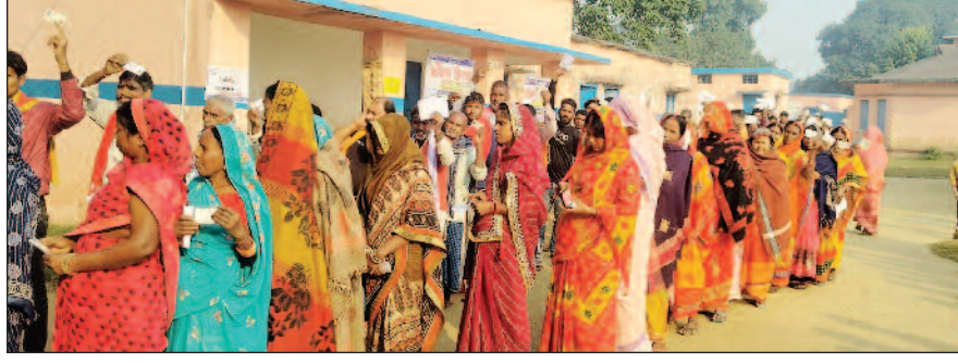
बुध पर कतारबद्ध मतदाता