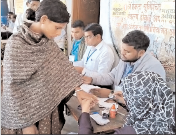
गया के बेलागंज में प्रसव के बाद अस्पताल से निकलकर बूथ पर पहुंची प्रसूता