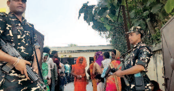
बेतिया के एक बुध पर तैनात सुरक्षा के जवान