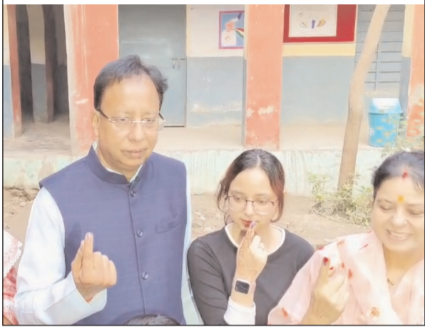
बेतिया के बूथ संख्या 73 पर बीजेपी सांसद डॉ. संजय जायसवाल ने सबसे पहले मतदान किया