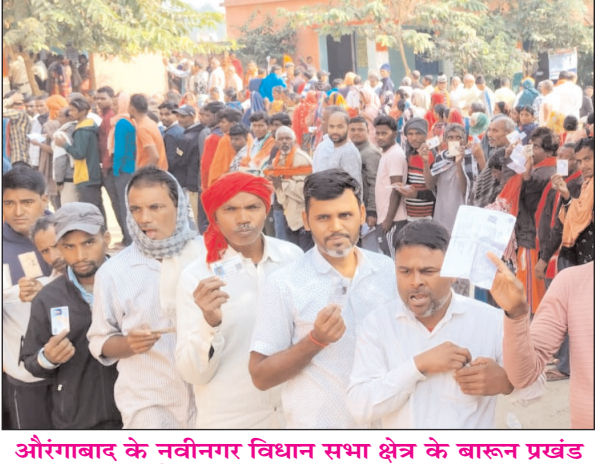
औरंगाबाद के नवीनगर विधान सभा क्षेत्र के बारून प्रखंड अंतर्गत बूथ संख्या 70 पर लंबी कतार