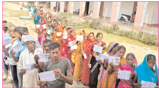
दूसरे चरण में मतदान के लिए मतदाताओं की लगी लंबी कतार