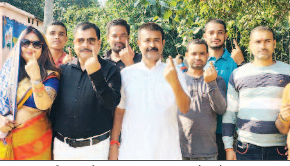
नरकटियागंज के एक बुध पर मतदान करने पहुंचे मतदाता

बेतिया/नवबिहार टाइम्स ब्यूरो। विधानसभा चुनाव के दूसरे चरण का मतदान मंगलवार को शांतिपूर्ण वातावरण में संपन्न हुआ। इस दौरान अब तक के प्राप्त सूचना के अनुसार लगभग 71-72 प्रतिशत मतदान संपन्न हुआ। इसके लोकर सुबह से ही मतदाताओं में हर जगह भारी उत्साह दिखा। पहले चरण के मतदान में महिला और पुरुष ने बड़ चढ़कर अपने मताधिकार का प्रयोग किया। खासकर बुजुर्गों, महिलाओं, युवा मतदाताओं केसाथ नये मतदाताओं में अपना प्रतिनिधि चुनने तथा लोकतंत्र के प्रति अपने दायित्व का निर्वहन करने के लिए भारी उत्साह दिखा। वहीं मतदान केंद्रों में दिव्यांग, वृद्ध महिला मतदाताओं ने उत्साहपूर्वक अपने मताधिकार का प्रयोग किया। युवा मतदाताओं का कहना था कि पहली बार मतदान करना उनके लिए गर्व की बात है। उन्हें अपने वोट से बेहतर संस्कार चुनने का मौका मिला है। मंगलवार को जिले के नौ विधानसभा क्षेत्रों में सुबह से बजे मतदान शुरू होने के पहले ही लोग वोटिंग के लिए पहुंचने लगे थे। जिसको लेकर अधिकार मतादन केंद्रों पर मतदाताओं की लंबी लाईन लग चुकी थी। जैसे जैसे दिन चढ़ा मतदाताओं का उत्साह बढ़ता गया। शहर की तुलना में ग्रामीण क्षेत्रों में लोगों ने भारी संख्या में मतदान किया। शाम छह बजे के बाद भी कई मतदान केंद्रों पर मतदाताओं की लाईन लगी रही। मतदान केंद्रों पर प्रशासन की ओर से मतदाताओं की सहायता एवं सुविधा के लिए हेल्प डेस्क बनाया गया था। जहां निर्धारित केंद्र पर महिला कर्मी मौजूद रहे। चुनाव में कोई मतदाता मतदान करने से वंचित नहीं रहे इसके लिए चुनाव आयोग ने 12 दस्तावेजों का विकल्प प्रयोग करने को लेकर निर्देश जारी किया था।