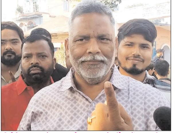
निर्वलीय सांसद राजेश रंजन उर्फ पप्पू यादव ने पूर्णिया में मतदान किया