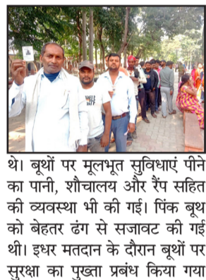
थी। बूथों पर मूलभूत सुविधाएं पीने का पानी, शौचालय और रैप सहित की व्यवस्था भी की गई। पिक बूथ को बेहतर ढंग से सजावट की गई थी। इधर मतदान के दौरान बूथों पर सुरक्षा का पुख्ता प्रबंध किया गया