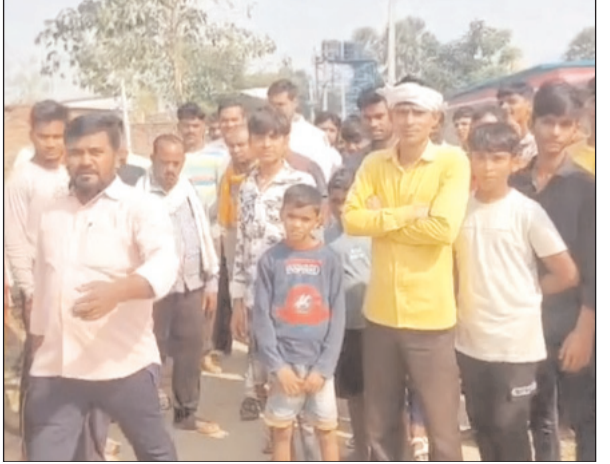
रोहतास के चेनारी विधानसभा में बूथ संख्या 209 पर वोट बहिष्कार।