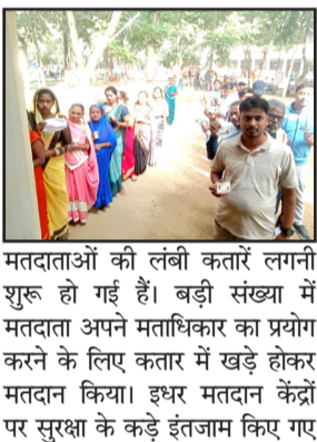
मतदाताओं की लंबी कतारें लगनी शुरू हो गई हैं। बड़ी संख्या में मतदाता अपने मतधिकार का प्रयोग करने के लिए कतार में खड़े होकर मतदान किया। इधर मतदान केंद्रों पर सुरक्षा के कड़े इंतजाम किए गए

नवबिहार टाइम्स संवाददाता औरंगाबाद। बिहार विधानसभा चुनाव के तहत ओबरा विधानसभा-220 के 387 बूथों पर मंगलवार को मतदान शांतिपूर्ण ढंग से शुरू किया गया। चुनाव आयोग के निर्देशानुसार सुबह 7 बजे ठीक इवीएम ऑन होते ही वोटिंग प्रक्रिया शुरू की गई। वहीं मतदान केंद्रों पर मतदान अपने मतधिकार का प्रयोग करने के लिए कतार में खड़े होकर मतदान किया। इधर मतदान केंद्रों पर सुरक्षा के कड़े इंतजाम किए गए