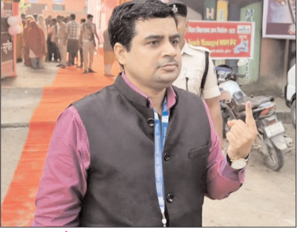
सुपौल में जिलाधिकारी ने किया मतदान