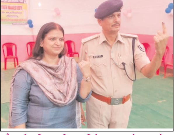
कैमूर के पुलिस अधीक्षक हरिमोहन शुक्ला ने डाला वोट