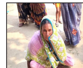
हाथों पर चलकर मतदान केंद्र पहुंचती दिव्यांग महिला।

केंद्र तक उनके परिजन ले जाते देखे। इसी विधानसभा क्षेत्र के हरीदासपुर में एक बुजुर्ग को उसके पोते ने व्हीलचेयर के मदद से मतदान केंद्र तक पहुंचाया। मखदुमपुर विधानसभा क्षेत्र के पुनहरदा मतदान केंद्र पर एक दिव्यांग महिला महिला समूह के साथ हाथ पर चलते हुए मतदान केंद्र पहुंची, जिसे देखकर वहां उपस्थित मतदान कर्मी और पुलिस के जवानों