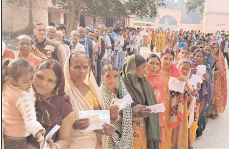
नवादा में चोटिंग के लिए लगी लंबी लाइन, खड़े हुए मतदाता