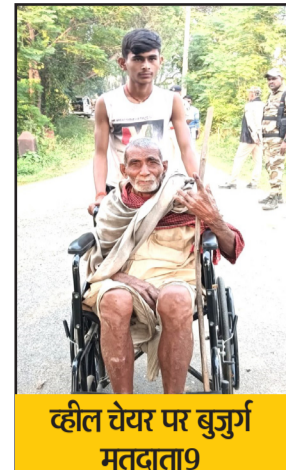
कहल चेर पर बुजुर्ग मतदाता 9

मतदाता लोकतंत्र के इस महापर्व में बढ़-चढ़कर हिस्सा ले रहे थे। प्रत्येक विधानसभा क्षेत्र में महिलाओं के लिए बनाए गए 10 पिक मतदान केंद्र पर भी महिलाओं की अच्छी खासी भीड़ देखी गई। यहां पर महिलाओं द्वारा जबरदस्त वोटिंग की बात बताई गई है। हालांकि अभी तक यह स्पष्ट नहीं हुआ है कि पुरुष और महिला मतदाता अलग-अलग कितना प्रतिशत मत