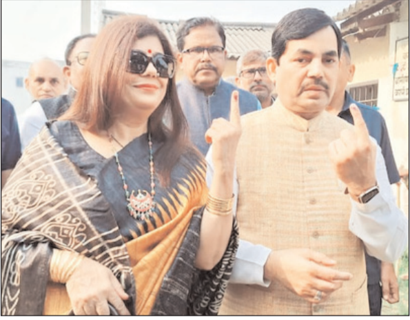
पूर्व मंत्री शाहनवाज हुसैन ने परिवार के साथ किया मतदान