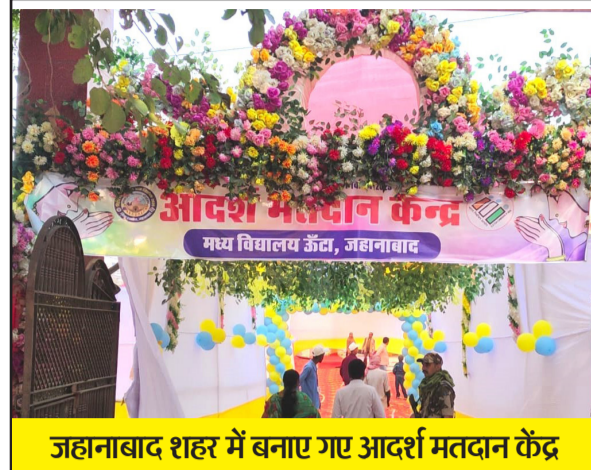
जहानाबाद शहर में बनाए गए आदर्श मतदान केंद्र

216 जहानाबाद विधानसभा क्षेत्र में अंतिम आंकड़ा प्राप्त तक 63.22% मतदाताओं ने अपने मतधिकार का प्रयोग किया है। वहीं 217- घोसी विधानसभा क्षेत्र में 64.11% मतदाताओं ने