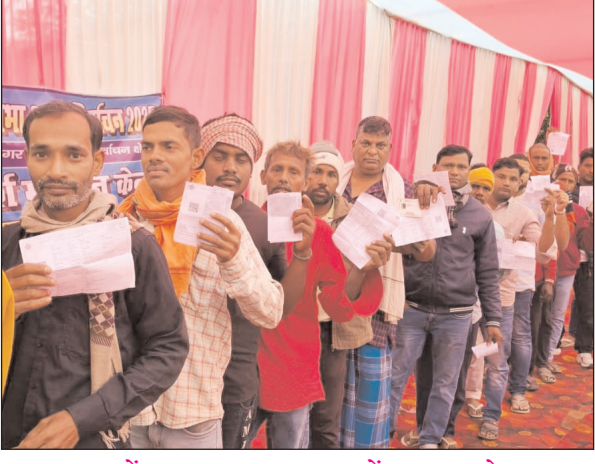
गया में एक बूथ पर मतदाताओं का लगा मेला