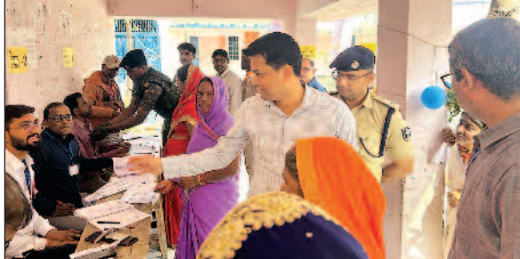
चनपटिया के एक बुध का निरीक्षण करते डीएम एसजी