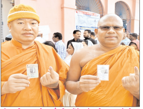
बोधगया विधानसभा सीट पर बौद्ध भिक्षुओं ने अपने मतधिकार का प्रयोग किया