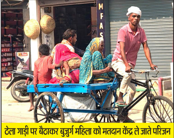
ठेला गाड़ी पर बैठकर बुजुर्ग महिला को मतदान केंद्र ले जाते परिजन

नवबिहार टाइम्स ब्यूरो जहानाबाद। जिले के सभी तीन विधानसभा क्षेत्र में कड़ी सुरक्षा व्यवस्था और चुस्त प्रशासनिक कदम के बीच शांतिपूर्ण माहौल में विधानसभा चुनाव संपन्न हुआ। मंगलवार की सुबह 7:00 से लगभग सभी मतदान केंद्रों पर मतदान की प्रक्रिया एक साथ प्रारंभ हुई। कई स्थानों पर मतदान के लिए निर्धारित समय सुबह 7:00 बजे से पूर्व ही मतदाताओं की लंबी कतार मतदान केंद्रों पर देखी गई। दिन चढ़ने के साथ ही मतदान की गति में भी तेजी देखने को मिली। सुबह 9:00 बजे से 3:00 बजे के बीच जहानाबाद के सभी तीन विधानसभा क्षेत्र में बंपर वोटिंग दर्ज की गई। इस बात के विधानसभा चुनाव में एक बार खास नजर आई जिसमें मतदान केंद्रों पर कड़ी सुरक्षा व्यवस्था के साथ-साथ मतदाताओं के लिए जरूरी सुविधाओं का भी ख्याल चुनाव आयोग और जिला प्रशासन की ओर से रखा गया था। यहां प्रत्येक विधानसभा क्षेत्र में बनाए गए दो आदर्श मतदान केंद्र पर