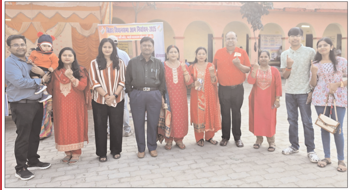
औरंगाबाद जिला मुख्यालय स्थित अनुग्रह मध्य विद्यालय में मतदान करने के बाद मतदान चिह्न दिखाते मतदाता

आत्मविश्वास के साथ वोट डाला और कहा कि अब वे अपने इलाके के विकास के फैसले में सीधे तौर पर भागीदारी चाहती हैं। गांवों में भी वही उत्साह देखने को मिला जो शहरों में था। धूल भरी पगडंडियों से गुजरते हुए लोग मतदान केंद्रों तक पहुंचे और गर्व से उंगली पर स्याही का निशान दिखाते हुए लौटे। चुनाव का यह शांतिपूर्ण और उत्सवमय रूप केवल लोकतंत्र की परिपक्वता का प्रमाण है। औरंगाबाद का यह अनुभव इस बात का संकेत है कि लोकतंत्र अब सचमुच जनता का उत्सव बन चुका है-जहाँ मतदाता मतदाता से नहीं, बल्कि बेहतर बिहार की उम्मीद से मुकाबला कर रहा है।