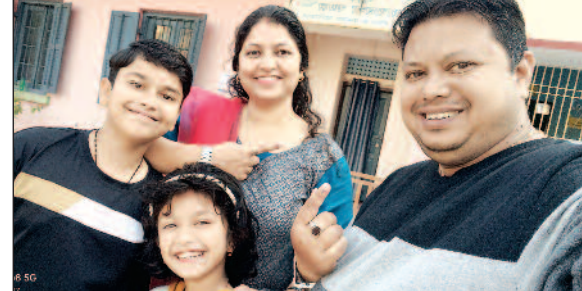
बेतिया के एक बुध पर मतदान करने पहुंचे टपटि

बेतिया/नवबिहार टाइम्स ब्यूरो। विधानसभा चुनाव के दूसरे चरण का मतदान मंगलवार को शांतिपूर्ण वातावरण में संपन्न हुआ। इस दौरान अब तक के प्राप्त सूचना के अनुसार लगभग 71-72 प्रतिशत मतदान संपन्न हुआ। इसके लोकर सुबह से ही मतदाताओं में हर जगह भारी उत्साह दिखा। पहले चरण के मतदान में महिला और पुरुष ने बड़ चढ़कर अपने मताधिकार का प्रयोग किया। खासकर बुजुर्गों, महिलाओं, युवा मतदाताओं केसाथ नये मतदाताओं में अपना प्रतिनिधि चुनने तथा लोकतंत्र के प्रति अपने दायित्व का निर्वहन करने के लिए भारी उत्साह दिखा। वहीं मतदान केंद्रों में दिव्यांग, वृद्ध महिला मतदाताओं ने उत्साहपूर्वक अपने मताधिकार का प्रयोग किया। युवा मतदाताओं का कहना था कि पहली बार मतदान करना उनके लिए गर्व की बात है। उन्हें अपने वोट से बेहतर संस्कार चुनने का मौका मिला है। मंगलवार को जिले के नौ विधानसभा क्षेत्रों में सुबह से बजे मतदान शुरू होने के पहले ही लोग वोटिंग के लिए पहुंचने लगे थे। जिसको लेकर अधिकार मतादन केंद्रों पर मतदाताओं की लंबी लाईन लग चुकी थी। जैसे जैसे दिन चढ़ा मतदाताओं का उत्साह बढ़ता गया। शहर की तुलना में ग्रामीण क्षेत्रों में लोगों ने भारी संख्या में मतदान किया। शाम छह बजे के बाद भी कई मतदान केंद्रों पर मतदाताओं की लाईन लगी रही। मतदान केंद्रों पर प्रशासन की ओर से मतदाताओं की सहायता एवं सुविधा के लिए हेल्प डेस्क बनाया गया था। जहां निर्धारित केंद्र पर महिला कर्मी मौजूद रहे। चुनाव में कोई मतदाता मतदान करने से वंचित नहीं रहे इसके लिए चुनाव आयोग ने 12 दस्तावेजों का विकल्प प्रयोग करने को लेकर निर्देश जारी किया था।