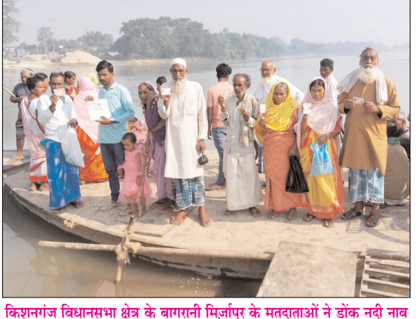
किशनगंज विधानसभा क्षेत्र के बागरानी मिर्जापुर के मतदाताओं ने डॉक नदी नाव से पारकर मतदान केंद्र संख्या-55 पहुंच अपने मतधिकार का प्रयोग किया