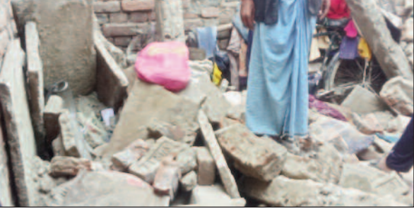
मृतक गो बबलू के कमरे में पड़े मलबे