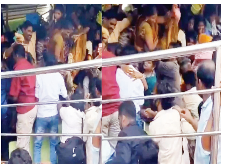
आयोजकों का पूरा ध्यान अपनी शक्ति, सामर्थ्य अथवा लोकप्रियता के प्रदर्शन पर रहता है। व्यवस्था और जन सुरक्षा को हारिये पर डाल दिया जाता है।

प्रायः देखा जाता है कि समुचित सुरक्षा-व्यवस्था न होने अथवा कुप्रबंधन के कारण भगदड़ मचती है। कई बार आयोजनों से जुड़े प्रबंधन और प्रशासन की घोर लापरवाही भी अनेक दुर्घटनाओं का अनुमान लगाया जा सकता है। अधिकांश बड़े आयोजनों या राजनीतिक रैलियों के दौरान यह देखने में आता है कि