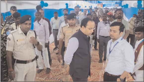
किसी भी प्रकार की लापरवाही स्वीकार नहीं की जाएगी। उन्होंने

गया। जिलाधिकारी शशांक शुभंकर और वरीय पुलिस अधीक्षक आनंद कुमार ने सोमवार को शेरघाटी स्थित डिस्पैच सेंटर का निरीक्षण किया। इस दौरान उन्होंने चुनाव सामग्री के वितरण की प्रक्रिया की बारीकी से समीक्षा की और उपस्थित अधिकारियों को आवश्यक दिशा-निर्देश दिए। जिलाधिकारी शशांक शुभंकर ने स्पष्ट किया कि मतदान कार्य में