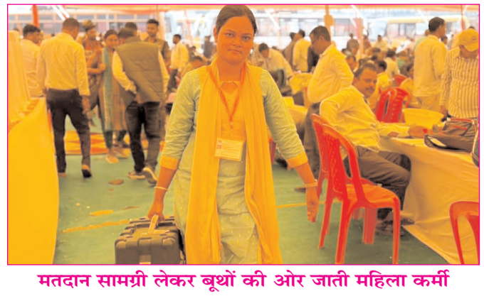
मतदान सामग्री लेकर बूथों की ओर जाती महिला कर्मी

* औरंगाबाद एवं बोकारो से प्रकाशित * www.navbihartime.com