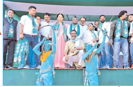
घाटशिला में आयोजित चुनावी सभा के दौरान इस अंदाज में दिखे मुख्यमंत्री हेमंत सोरेन