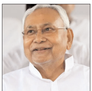
करोड़ युवाओं को नौकरी और रोजगार देने का है। उक्त बातें शुक्रवार को मुख्यमंत्री नीतीश कुमार ने एनडीए

गवबिहार टाइम्स ब्यूरो पटना। सूबे में अब कोई भय का वातावरण नहीं है। सरकार ने बड़े पैमाने पर कब्रिस्तानों की घेराबंदी कराई है। अब तक दो लाख 58 हजार शिक्षकों की बहाली की जा चुकी है जबकि 70 हजार पदों पर बहाली की तैयारी चल रही है। चुनाव बाद सरकार बनते ही यह बहाली प्रक्रिया आरंभ कर दी जाएगी। पुराने और नये मेडिकल कॉलेजों को विकसित किया गया है। दस लाख नौकरियां और दस लाख रोजगार पहले ही दिए जा चुके हैं। अब लक्ष्य एक