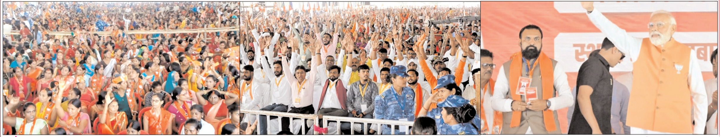
औरंगाबाद जिले के दरभंगा में एनडीए प्रत्याशियों के पक्ष में आयोजित चुनावी सभा में उमड़ी लोगों की भीड़ (बाएं) एवं लोगों का अभिवादन करते प्रधानमंत्री नरेन्द्र मोदी (दाएं)