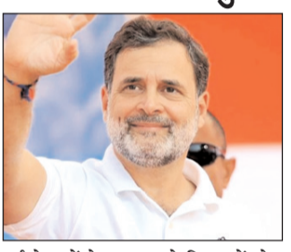
कई नेताओं ने गुरुवार को बिहार में वोट देने के साथ-साथ दिल्ली में भी मतदान किया। श्री गांधी ने कहा कि एक तरफ भाजपा नेताओं को एक से ज्यादा वोट देने की अनुमति (श्रेष्ठ पृष्ठ 7 पर)

गवबिहार टाइम्स ब्यूरो भागलपुर। कांग्रेस के वरिष्ठ नेता और लोकसभा में नेता प्रतिपक्ष राहुल गांधी ने कहा कि भाजपा के वोट चोरी की योजना से बिहार की जनता को सतर्क रहने की जरूरत है। उन्होंने शुक्रवार को यहां भागलपुर क्षेत्र से महागठबंधन के कांग्रेस प्रत्याशी के समर्थन में आयोजित एक जनसभा को संबोधित करते हुए कहा कि हरियाणा, छत्तीसगढ़ और महाराष्ट्र में वोट चोरी का तरीका अपनाया गया था और अब वही खेल बिहार में चलाया जा रहा है। भाजपा के