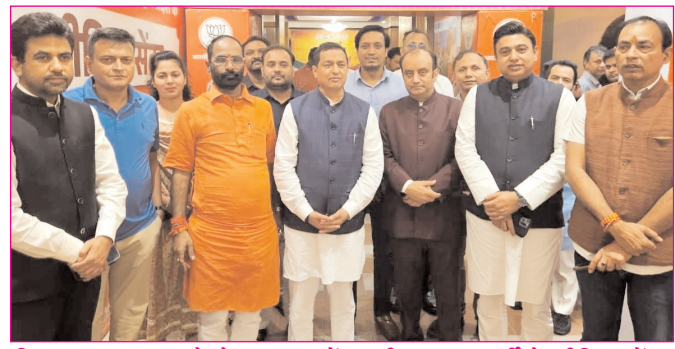
विधानसभा चुनाव को लेकर पटना में भारतीय जनता पार्टी के मीडिया सेंटर में पार्टी के दिग्गज प्रवक्ताओं और मीडिया प्रभारियों का जुटान।

* मूल्य : 3.00 रुपये * औरंगाबाद एवं बोकारो से प्रकाशित * www.navbihartime.com