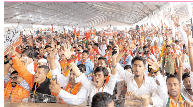
छपरा में पीएम नरेन्द्र मोदी की सभा में उमड़ी भीड़

* मूल्य : 3.00 रुपये * औरंगाबाद एवं बोकारो से प्रकाशित * www.navbihartime.com