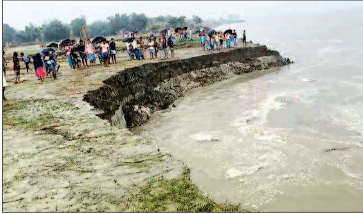
"हर साल हम कटाव झेलते हैं, लेकिन इस बार पानी का बहाव और कटाव की रफ्तार तेज है। समय रहते कोई प्रभावी कदम नहीं उठाये गये तो बड़े भू भाग के नदी में समा जाने का खतरा

नवबिहार टाइम्स संवाददाता अमदाबाद/कटिहार। प्रखंड के खड्डी भवानीपुर पंचायत के बबलाबन्ना गांव में गुरुवार अहले सुबह से ही गंगा नदी किनारे भीषण कटाव जारी है। तेज कटाव के कारण देखते ही देखते कई बीघा उपजाऊ भूमि नदी में समा गये। ग्रामीणों के मुताबिक, कटाव का दायरा बढ़ता जा रहा है, जिससे आसपास के दर्जनों घरों पर कटाव का खतरा मंडरा रहा है। अचानक ऊपरी कटाव से आस पास के ग्रामीण डरे सहमे हैं, अफसर-तफरी का माहौल है। लोग अपने आशियाने छोड़ सामानों के अन्यत्र पलायन को विवश हैं। स्थानीय लोगों का कहना है कि प्रशासन को कई बार कटाव की सूचना दी गई, लेकिन अब तक कोई ठोस कदम नहीं उठाया गया है। ग्रामीणों ने बताया —