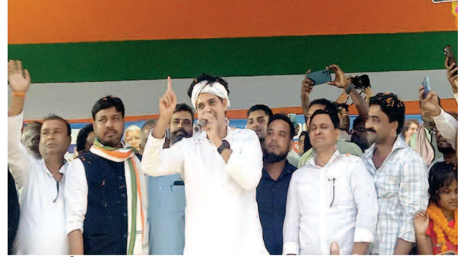
नवबिहार टाइम्स संवाददाता