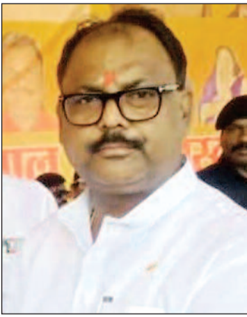
और लगातार गाली-गलौज करता रहा। विधायक ने कहा कि यह लोकतंत्र का