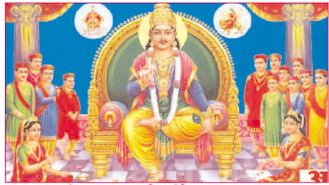
चित्रगुप्त पूजा की हार्दिक शुभकामनाएं

* मूल्य : 3.00 रुपये * औरंगाबाद एवं बोकारो से प्रकाशित * www.navbihartime.com