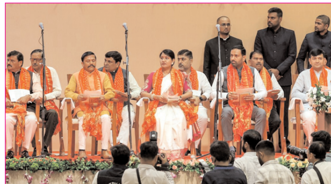
गुजरात में नए मंत्रियों ने ली पद एवं गांपनीयता की शपथ

* औरंगाबाद एवं बोकारो से प्रकाशित * www.navbihartime.com