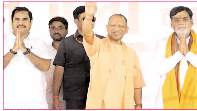
यूपी के सीएम योगी आदित्यनाथ ने दानापुर से किया चुनावी सभा का आगाज

* रजि. नंबर : 52290/90 * वर्ष : 36 * अंक : 141 * पृष्ठ : 12 * औरंगाबाद, शुक्रवार, 17 अक्टूबर 2025 * मूल्य : 3.00 रुपये * औरंगाबाद एवं बोकारो से प्रकाशित * www.navbihartime.com