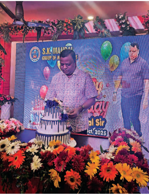
नर्सिंग एंड पैरामेडिकल साइंस, समस्तीपुर। विद्यापति इंस्टीट्यूट ऑफ हायर एजुकेशन, समस्तीपुर। कृष्णा इंस्टीट्यूट ऑफ