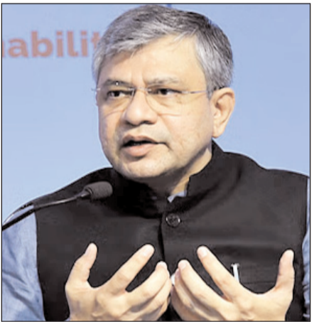
साइनबोर्ड, सूचना प्रणाली। मंत्री ने कहा कि ये अपग्रेड राजस्थान के विभिन्न मंडलों जैसे कि जोधपुर, जयपुर, अजमेर और बीकानेर में लागू किए जा रहे हैं। उन्होंने कहा कि इसके अलावा टिकाऊपन और आसानी से धुलने के लिए चुने गए सांगानेरी प्रिंट फैब्रिक का

नई दिल्ली। केंद्रीय रेल मंत्री अश्विनी वैष्णव ने गुरुवार को राजस्थान के जयपुर में 65 छोटे और मध्यम स्टेशनों पर नए प्लेटफॉर्म, प्लेटफॉर्म अपग्रेडेशन और एक्सटेंशन और एक इंटीग्रेटेड पैसेंजर इंफोर्मेशन सिस्टम का उद्घाटन किया। इसके साथ ही उन्होंने जयपुर-असरवा एक्सप्रेस के सभी एसी क्लास के यात्रियों के लिए प्रिंटेड कंबल कवर भी लॉन्च किए गए। मीडिया से बात करते हुए केंद्रीय रेल मंत्री अश्विनी वैष्णव ने कहा कि आज रेलवे ने एक नई पहल शुरू की है। यह पहल यात्रियों के जीवन में एक बड़ा बदलाव लाने का एक प्रयास है। रेलवे सिस्टम में कंबल का इस्तेमाल हमेशा से रहा है लेकिन कंबल को लेकर हमेशा एक संशय रहा है और इस संशय को दूर करने के लिए जयपुर रेलवे स्टेशन से पायलट कार्यक्रम के रूप में एक ट्रेन में कंबल कवर की व्यवस्था शुरू की गई है। उन्होंने कहा कि अगर यह प्रयोग सफल रहा तो इसे पूरे देश में विस्तारित किया जाएगा। साथ ही छोटे स्टेशनों पर भी सुविधाएं बढ़ाई जाएंगी, खासकर प्लेटफॉर्म की ऊंचाई,