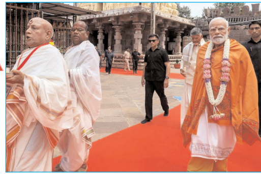
आंध्र प्रदेश के श्रीशैलम मंदिर में पूजा-अर्चना करने पहुंचे प्रधानमंत्री नरेंद्र मोदी