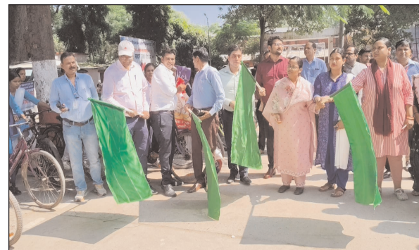
नवबिहार टाइम्स ब्यूरो

आरा। समाहरणालय परिसर से निर्वाचन पदाधिकारी भोजपुर के निर्देशानुसार स्वीप कोषांग के द्वारा मतदाता को जागरूक करने के लिए बुधवार को साइकिल रैली का आयोजन किया गया। इस का मुख्य उद्देश्य बच्चों द्वारा अपने-अपने माता-पिता, रिश्तेदार, पड़ोसी से मतदान करने के लिए अनुरोध करेंगे। साथ ही साथ नए युवा मतदाताओं को वोट देने के लिए प्रेरित करेंगे। उप विकास आयुक्त