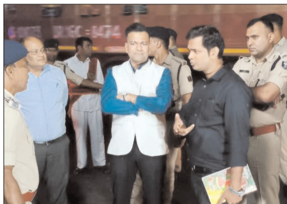
साहेबपुर कमाल प्रखंड के हीरा टोल के पास, बखरी प्रखंड के साखी आरामील के पास तथा