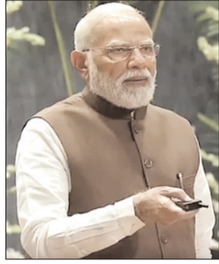
योजनाओं पर 35,000 करोड़ रुपये से अधिक खर्च करने जा रही है। प्रधानमंत्री ने कहा कि जब वंचितों को

के दो महान रतों की जयंती है जिन्होंने इतिहास रच दिया। भारत रत्न जयप्रकाश नारायण और भारत रत्न नानाजी देशमुख, ये दोनों महान सपूत ग्रामीण भारत की आवाज और लोकतांत्रिक क्रांति के अग्रदूत थे। वे किसानों और गरीबों के कल्याण के लिए समर्पित थे। आज इस ऐतिहासिक दिन पर देश की आत्मनिर्भरता और किसानों के कल्याण के लिए दो महत्वपूर्ण नई योजनाओं का शुभारंभ किया जा रहा है। पहली प्रधानमंत्री धन धान्य कृषि योजना और दूसरा दलहन आत्मनिर्भरता मिशन। ये दोनों योजनाएं भारत के लाखों किसानों का भाग्य बदल देंगी। सरकार इन