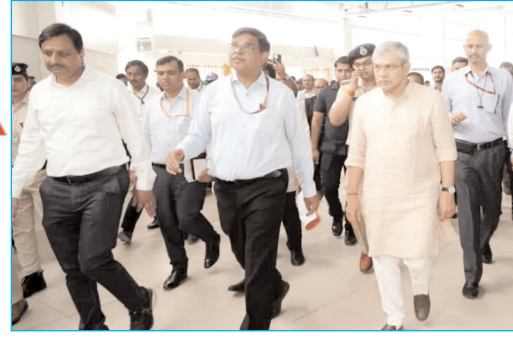
नॉर्दन रेलवे के जीएम अशोक वर्मा व अन्य अधिकारियों के साथ नई दिल्ली रेलवे स्टेशन का निरीक्षण करते रेल मंत्री अश्विनी वैष्णव

प्रधानमंत्री ने कृषि क्षेत्र में की 35440 करोड़ रुपये की दो बड़ी योजनाओं की शुरुआत