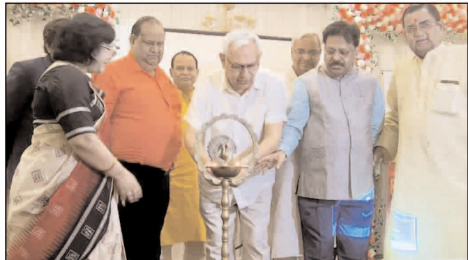
यह दिवस मानसिक स्वास्थ्य को लेकर अंतरराष्ट्रीय चिंता को सामने लाने और मानसिक स्वास्थ्य सेवाओं की उपलब्धता तथा पहुंच पर ध्यान केंद्रित करने का अवसर देता है। उन्होंने आपदाओं, प्राकृतिक विपदाओं और आपात स्थितियों में मानसिक स्वास्थ्य सेवाओं की तत्काल जरूरत और उनके