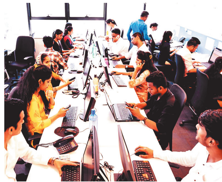
जरिए आत्मनिर्भरता का अवसर भी दिया।

सबसे महत्वपूर्ण बदलाव उस वर्ग में देखा गया है, जिसे भारत की कार्यशक्ति की रीढ़ कहा जा