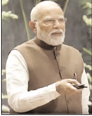
योजनाओं पर 35,000 करोड़ रुपये से अधिक खर्च करने जा रही है। प्रधानमंत्री ने कहा कि जब वंचितों को

के दो महान रत्नों की जयंती है जिन्होंने इतिहास रच दिया। भारत रत्न जयप्रकाश नारायण और भारत रत्न नानाजी देशमुख, ये दोनों महान सपूत ग्रामीण भारत की आवाज और लोकतांत्रिक क्रांति के अग्रदूत थे। वे किसानों और गरीबों के कल्याण के लिए समर्पित थे। आज इस ऐतिहासिक दिन पर देश की आत्मनिर्भरता और किसानों के कल्याण के लिए दो महत्वपूर्ण नई योजनाओं का शुभारंभ किया जा रहा है। पहली प्रधानमंत्री धन धान्य कृषि योजना और दूसरा दलहन आत्मनिर्भरता मिशन। ये दोनों योजनाएं भारत के लाखों किसानों का भाग्य बदल देंगी। सरकार इन