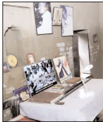
नारायण स्मृति भवन पहुंचे, जहां आयोजित कार्यक्रम में उपराष्ट्रपति करीब 45 मिनट तक रुके। वहीं लोकनायक के गांव के लोगों ने भी उपराष्ट्रपति को अपनी समस्याओं से अवगत कराया। उपराष्ट्रपति ने कहा कि लोकनायक के आदर्श आज भी लोकतंत्र की राह को रोशन करते हैं। उन्होंने कहा कि लोकनायक जयप्रकाश नारायण स्वतंत्रता आंदोलन के सिपाही थे और उन्हें

छपरा। लोकनायक जयप्रकाश नारायण की जयंती के अवसर पर शनिवार को उपराष्ट्रपति सीपी राधाकृष्णन बिहार के सिताब दरिया पहुंचे। उपराष्ट्रपति ने जेपी की आदमकद प्रतिमा पर माल्यार्पण किया। जेपी की जयंती के अवसर पर आयोजित समारोह के लिए उपराष्ट्रपति पटना से सड़क मार्ग के जरिए सुरक्षा व्यवस्था के बीच पहुंचे और उन्हें नमन किया। लोकनायक जयप्रकाश नारायण, जिन्हें 'जेपी' के नाम से भी जाना जाता है, 1970 के दशक के मध्य में तत्कालीन प्रधानमंत्री इंदिरा गांधी के खिलाफ विपक्ष का नेतृत्व करने के लिए याद किए जाते हैं। सारण जिले में पहली बार आए उपराष्ट्रपति ने जेपी की प्रतिमा पर माल्यार्पण के बाद स्थानीय लोगों से भी मुलाकात की और उनकी समस्याओं को भी सुना। इस दौरान काफी लोगों ने अपनी अपनी बातों को रखा। इसके बाद उपराष्ट्रपति लोकनायक जयप्रकाश