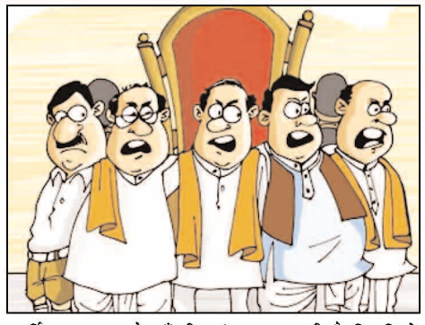
आर्थिक क्षमता और ऊँची पहुँच तय करती है कि किसे टिकट मिलेगा। वास्तविकता यह है कि हर दल में अब

नहीं होते बल्कि जिस सीट पर जीत की संभावना दिखे या पार्टी टिकट देने को तैयार हो, वहीं से चुनाव मैदान में कूद पड़ते हैं। इस बार भी कई ऐसे नाम सक्रिय हैं जो पैसे, प्रभाव या संपर्कों के दम पर टिकट पाने की कोशिश में लगे हैं। कहा जा सकता है कि बिहार की राजनीति में अब समर्पण और संघर्ष की बजाय पूंजी और पहुँच का सिक्का अधिक चल रहा है। पार्टी के भीतर वर्षों तक काम करने वाले निष्ठावान कार्यकर्ताओं में गहरी निराशा है। कई स्थानीय नेताओं का कहना है कि वे संगठन के लिए सालों से संघर्ष कर रहे हैं, लेकिन टिकट की दौड़ में हमेशा 'धनपशुओं' और 'ठेकेदार नेताओं' के आगे पिछड़ जाते हैं। एक वरिष्ठ कार्यकर्ता ने नाम न छानने की शर्त पर कहा, अब पार्टी का सिद्धांत या वैचारिक प्रतिबद्धता नहीं, बल्कि