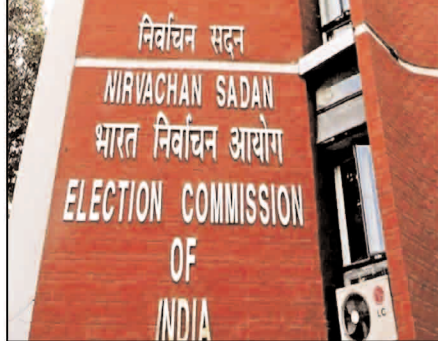
के खते में हैं। चुनाव आयोग ने कहा है कि दो चरणों में बिहार में होने वाले विधानसभा चुनाव के लिए करीब 8.5 लाख मतदान पदाधिकारियों की तैनाती की जाएगी। इनमें करीब 4.53 लाख मतदानकर्मी होंगे।

नवबिहार टाइम्स ब्यूरो पटना। बिहार विधानसभा चुनाव के पहले चरण के लिए चुनाव आयोग 10 अक्टूबर यानी आज अधिसूचना जारी करेगा। इसके साथ ही नामांकन प्रक्रिया शुरू हो जाएगी। पहले चरण में 121 सीटों पर 6 नवंबर को मतदान होगा। 17 अक्टूबर तक उम्मीदवार अपना नामांकन दाखिल कर सकेंगे, जबकि 18 अक्टूबर को नामांकन पत्रों की जांच की जाएगी। 20 अक्टूबर तक उम्मीदवार अपने नाम वापस ले सकेंगे। 4 नवंबर की शाम 5 बजे पहले चरण का प्रचार थम जाएगा। इस चरण में परचा दाखिल करने के बाद प्रत्याशियों को प्रचार के लिए अधिकतम 15 दिन का समय मिलेगा। बिहार विधानसभा के पहले चरण में जिन 121 सीटों पर मतदान होना है, उनमें से 62 सीटों पर एनडीए का कब्जा है, जबकि 59 सीटें महागठबंधन