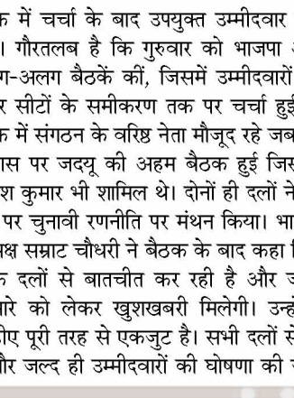
रहा है कि बीजेपी ने हर सीट के लिए तीन-तीन नाम तैयार इसलिए किए हैं, ताकि कोर ग्रुप और बाद में सीईसी की

बैठक में चर्चा के बाद उपयुक्त उम्मीदवार तय किए जा सकें। गौरतलब है कि गुरुवार को भाजपा और जदयू ने अलग-अलग बैठकें कीं, जिसमें उम्मीदवारों के चयन से लेकर सीटों के समीकरण तक पर चर्चा हुई। भाजपा की बैठक में संगठन के वरिष्ठ नेता मौजूद रहे जबकि मुख्यमंत्री आवास पर जदयू की अहम बैठक हुई जिसमें मुख्यमंत्री नीतीश कुमार भी शामिल थे। दोनों ही दलों ने अपने-अपने स्तर पर चुनावी रणनीति पर मंथन किया। भाजपा के प्रदेश अध्यक्ष सम्राट चौधरी ने बैठक के बाद कहा कि पार्टी सभी घटक दलों से बातचीत कर रही है और जल्द ही सीट बंटवारे को लेकर खुशखबरी मिलेगी। उन्होंने कहा कि एनडीए पूरी तरह से एकजुट है। सभी दलों से बात हो रही है और जल्द ही उम्मीदवारों की घोषणा की जाएगी।