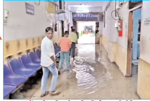
धनबाद में भारी बारिश से शहीद निर्मल महतो मेडिकल कॉलेज एवं अस्पताल के वार्ड में चुरा पानी