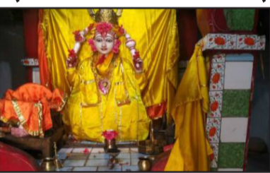
विष्णु को समर्पित है और भक्तों के बीच यह मान्यता है कि सच्चे मन से मांगी गई हर मनोकामना यहां पूरी होती है। रहुआ धाम पुनपुन नदी के किनारे पर स्थित है, जहां भगवान विष्णु के साथ-साथ अन्य देवी-देवताओं की प्रतिमाएं भी स्थापित हैं। गांव के लोग और पुजारी मिलकर इसकी देखरेख करते हैं। यहां पहुंचने के लिए सड़क की स्थिति ठीक नहीं थी, जिसके निर्माण की मांग स्थानीय लोगों द्वारा की जाती रही है। रहुआ धाम स्थितियों से चली आ रही एक धार्मिक आस्था का केंद्र है, जो कि इसकी प्राचीनता और भगवान विष्णु के प्रति

यहां मांगी गई मन्नत होती है पूरी पर्यटन मानचित्र से अबतक ओझल है विष्णु धाम