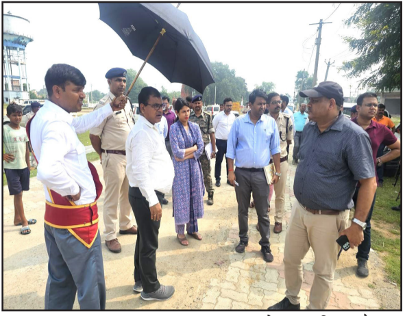
आवासन स्थल, यातायात व्यवस्था, ड्रॉप गेट एवं बैरिकेडिंग, देव सूर्य मंदिर परिसर, पार्किंग व्यवस्था, सफाई व्यवस्था, पेयजल सुविधा, शौचालय एवं प्रकाश व्यवस्था सहित मेला क्षेत्र के प्रमुख मार्गों का विस्तारपूर्वक