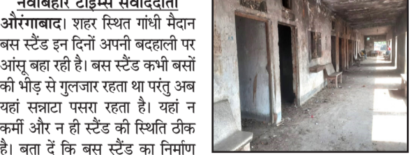
नवबिहार टाइम्स संवाददाता औरंगाबाद। शहर स्थित गांधी मैदान बस स्टैंड इन दिनों अपनी बद्दहाली पर आंसू बहा रही है। बस स्टैंड कभी बसों की भीड़ से गुलजार रहता था परंतु अब यहां सन्नटा पसरा रहता है। यहां न कर्मी और न ही स्टैंड की स्थिति ठीक है। बता दें कि बस स्टैंड का निर्माण 1953 में हुआ था। पहले बस स्टैंड में दिन-रात भीड़ लगी रहती थी परंतु आज यहां सन्नटा पसरा है। यहां पहले 10 बड़े होटल थे। लाइट की पूरी व्यवस्था थी। रात भर स्टैंड जगमगाते रहता था परंतु अब स्टैंड अंधेरा पसरा रहता है। यहां तक की बस स्टैंड का प्रतिशालय इन दिनों जुआरियों का अड्डा बन गया है। सुबह आठ बजे से देर रात तक जुआरी जुआ खेलते रहते हैं। प्रतिशालय में गंदगी लगी रहती है। गंदगी के कारण लोग यहां बैठने से कतराते हैं। वर्ष 1992-1993 से लेकर वर्ष 1999 तक स्टैंड से स्टैंड से