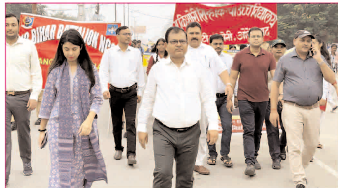
औरंगाबाद में रेली निकाल मतदाताओं को किया गया जागरूक

* मूल्य : 3.00 रुपये * औरंगाबाद एवं बोकारो से प्रकाशित * www.navbihartime.com