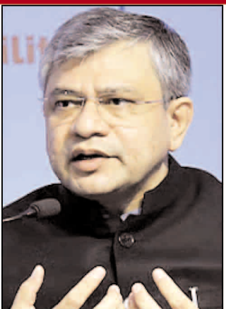
कि नई रेल परियोजनाओं से कोयला, कंटेनर, सीमेंट, फ्लाई ऐश, खाद्यान्न और इस्पात जैसी वस्तुओं का परिवहन

18 जिलों को कवर करने वाली चार परियोजनाओं से भारतीय रेलवे के मौजूदा नेटवर्क में लगभग 894 किलोमीटर का इजाफा होगा। स्वीकृत मल्टी-ट्रैकिंग परियोजना से लगभग 3,633 गांवों, जिनकी आबादी लगभग 85.84 लाख है और दो आकांक्षी जिलों (विदिशा और राजनांदगांव) तक कनेक्टिविटी बढ़ेगी। रेल मंत्री अश्विनी वैष्णव ने बताया कि बड़ी हुई लाइन क्षमता से गतिशीलता में उल्लेखनीय वृद्धि होगी जिसके परिणामस्वरूप भारतीय रेलवे की परिचालन दक्षता और सेवा विश्वसनीयता में सुधार होगा। ये मल्टी-ट्रैकिंग प्रस्ताव परिचालन को सुव्यवस्थित करने और भीड़भाड़ को कम करने के लिए तैयार हैं। उन्होंने कहा कि नई रेल परियोजनाओं से कोयला, कंटेनर, सीमेंट, फ्लाई ऐश, खाद्यान्न और इस्पात जैसी वस्तुओं का परिवहन