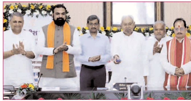
मुख्यमंत्री महिला रोजगार योजना के तहत 21 लाख लाभुकों के खाते में राशि अंतरित करते सीएम नीतीश कुमार

* मूल्य : 3.00 रुपये * औरंगाबाद एवं बोकारो से प्रकाशित * www.navbihartime.com