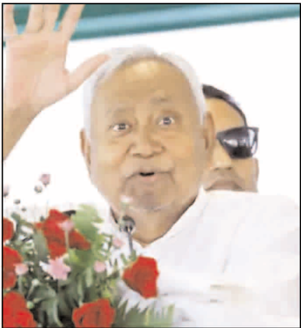
और आने वाले दिनों में बिहार में बड़े पैमाने पर रोजगार

मुजफ्फरपुर। मुख्यमंत्री नीतीश कुमार सोमवार को जिले के सकरा पहुंचे जहां उन्होंने 1333 करोड़ रुपए की लागत से 22 विकास की योजनाओं का उद्घाटन और शिलान्यास किया। उन्होंने कहा कि 2025 के बिहार विधानसभा चुनाव में अगर जनता मौका देगी तो बिहार में एक करोड़ लोगों को रोजगार दिया जाएगा। नीतीश कुमार ने जनसभा के दौरान लालू यादव और उनके परिवार पर भी निशाना साधा। मुख्यमंत्री ने अपने संबोधन में कहा कि 2005 के पहले बिहार की हालत बेहद खराब थी लेकिन जब उनकी सरकार बनी तो हर क्षेत्र में सुधार किया गया। उन्होंने कहा कि जब हम आए थे तो कुछ भी ठीक नहीं था। हमने सड़कों को बनाया, बिजली हर गांव तक पहुंचाई, शिक्षा और स्वास्थ्य व्यवस्था में बुनियादी बदलाव किए। नीतीश कुमार ने कहा कि केंद्र सरकार से लगातार सहयोग मिल रहा है