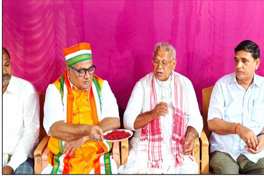
के लिए क्या किया है। उन्होंने कहा कि सिर्फ बयानबाजी और प्रचार से बिहार नहीं बदलेगा।

उनका अभियान आखिर कहां से फंडेड है। अगर उन्हें राजनीति करनी है, तो पहले अपने पैसे और उद्देश्य का खोत स्पष्ट करें।