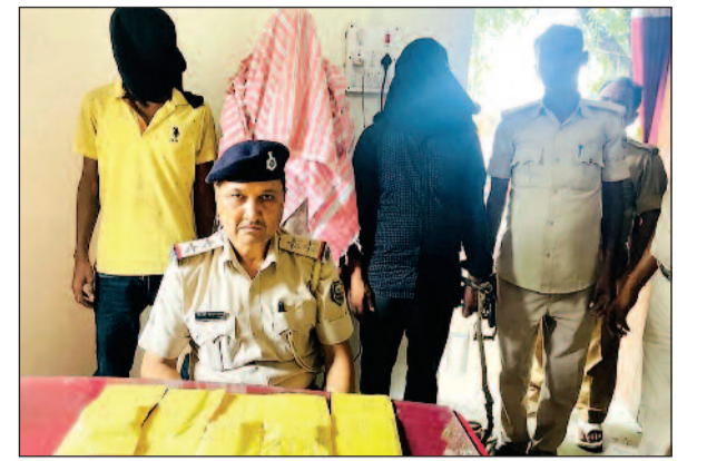
नवबिहार टाइम्स संवाददाता

नशीले पदार्थ तस्करो पर कड़ा प्रहार मझुआ प्रेमराज पुल पर तीन गिरफ्तार