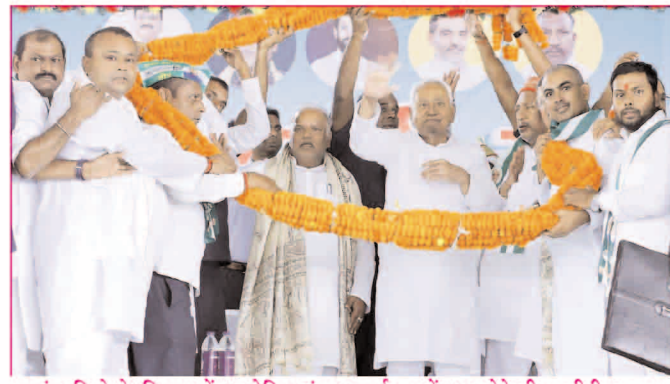
नालंदा जिले के हिलसा में आयोजित संवाद कार्यक्रम में भाग लेते सीएम नीतीश कुमार

* मूल्य : 3.00 रुपये * औरंगाबाद एवं बोकारो से प्रकाशित * www.navbihartime.com